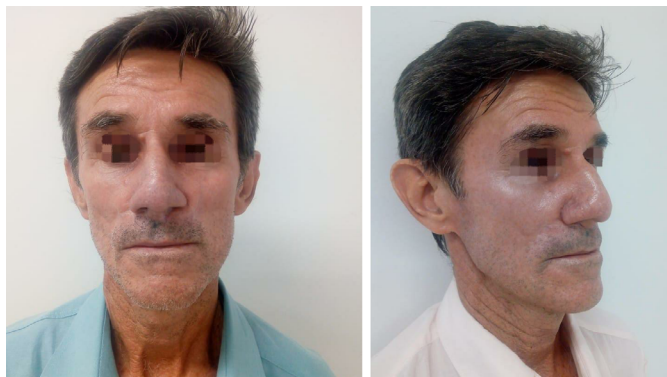
Figura 4. Resultado final.

O tratamento cirúrgico é o preferido quando o tumor apresenta grandes extensões. Nesse caso, foi preconizada a anestesia local com solução de Klein modificada 7 associada a sedação, a qual proporcionou analgesia e vasoconstrição adequada para a realizarmos a ressecção tumoral com boa visibilidade e a confecção dos retalhos para a sua reconstrução, evitando assim o uso da anestesia geral, a qual oferece maiores riscos para o paciente e maior custo para a instituição.