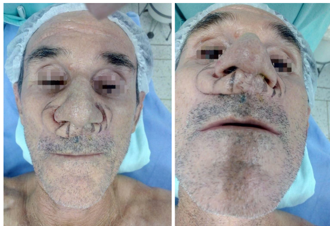
Figura 2. Demarcação cirúrgica para primeiro refinamento.

Após 2 meses, procedeu-se o segundo tempo, com refinamento do retalho (Figura 3). Posteriormente, houve nova etapa de refinamento, na qual chegamos ao resultado final (Figura 4).