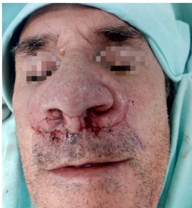
Figura 3. Pós-operatório do refinamento.