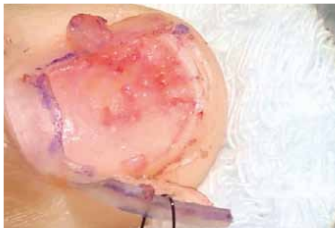
Figura 3 - Localização dos limites da tumoração por meio de microscopia e excisão da tumoração.