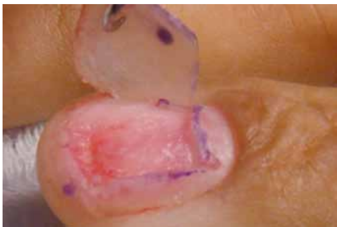
Figura 2 - Descolamento da lâmina ungueal de seu leito.