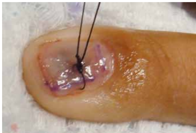
Figura 4 - Colocação e fixação da lâmina ungueal.

núcleos ovais ou cubóides, que se assemelham a células epiteliais 4 .