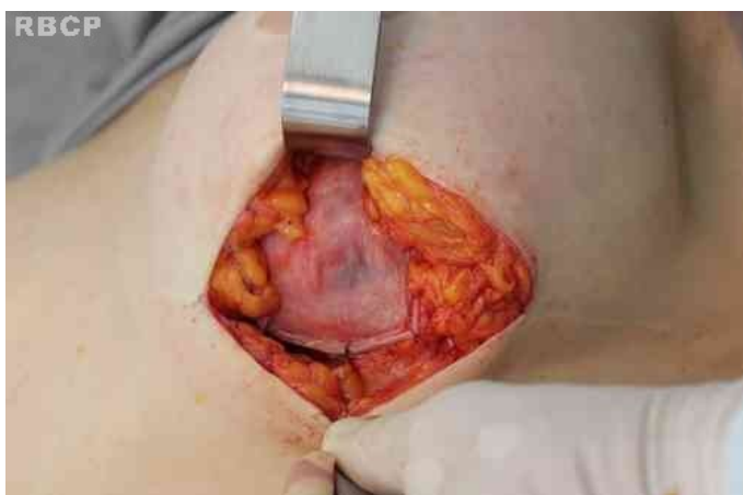
Figura 3 – Implante posicionado no plano retropeitoral.