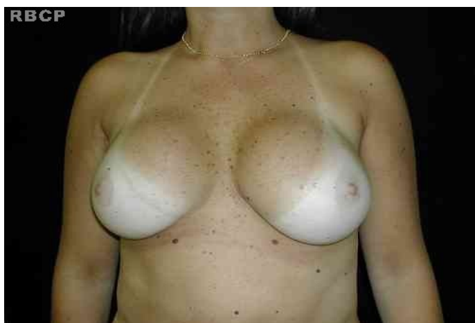
Figura 6 - Paciente com mamas de formato cosmeticamente agradável.

Observamos um caso de seroma unilateral que foi drenado, em três ocasiões, apresentando boa evolução. Não houve ocorrência de hematomas, deiscências ou problemas cicatriciais.