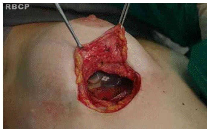
Figura 2 – Incisão do parênquima mamário até identificar a cápsula.

Dissecamos o espaço retromuscular seguindo a marcação prévia e seccionamos a origem do músculo peitoral maior em sua porção ínfero-medial, apenas o suficiente para provocar um relaxamento neste segmento e anular a tendência de subida dos implantes por pressão decorrente da ação muscular.