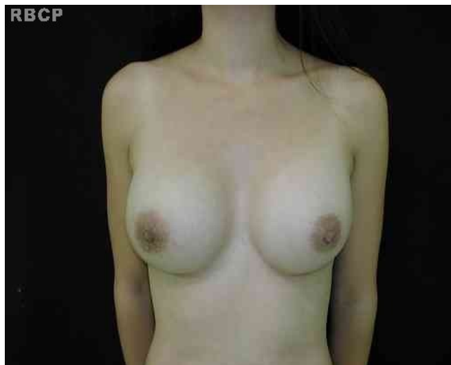
Figura 8 - Paciente com mamas de formato cosmeticamente agradável.