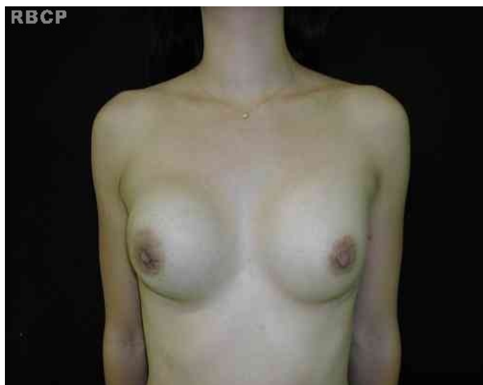
Figura 7 - Paciente com mamas de formato cosmeticamente agradável.