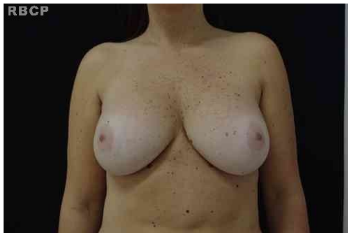
Figura 5 - Paciente com mamas de formato cosmeticamente agradável.