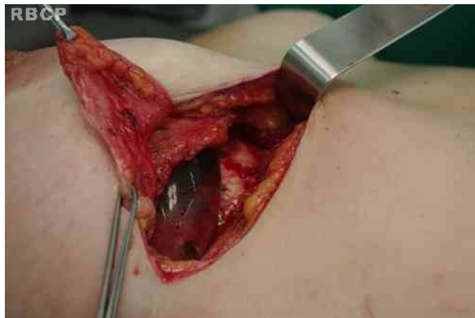
Figura 1 – Incisão do parênquima mamário até identificar a cápsula

anterior da cápsula seja rebatida inferiormente para posterior complemento da cobertura dos implantes. A lamela posterior aderida ao peitoral garante a adequada irrigação sanguínea do retalho.