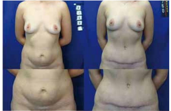
Figura 11 - Pré-operatório e pós-operatório de um ano.