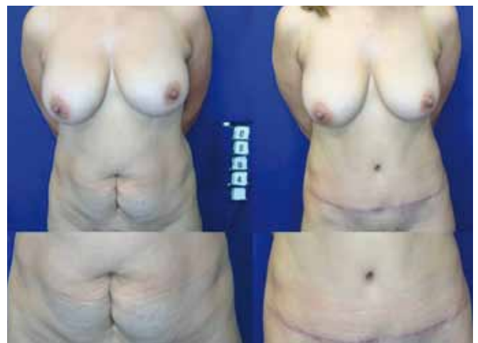
Figura 13 - Pré-operatório e pós-operatório de um ano.