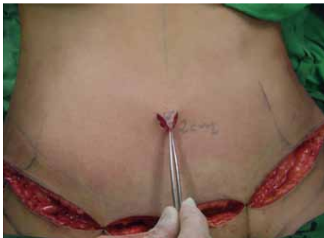
Figura 4 - Incisão realizada, retalho em "V" confeccionado.