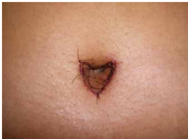
Figura 6 - Sutura final (aspecto final do pós-operatório).