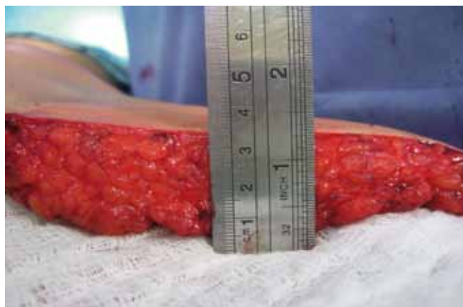
Figura 2 - Espessura do tecido abdominal (pele e tecido gorduroso).