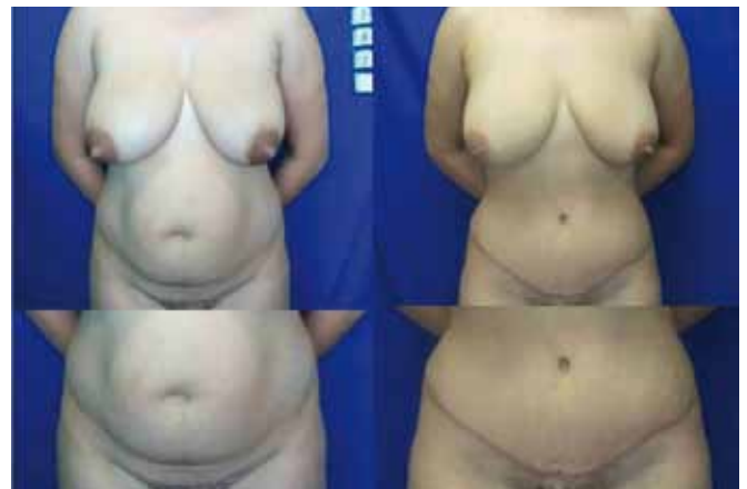
Figura 12 - Pré-operatório e pós-operatório de 9 meses.