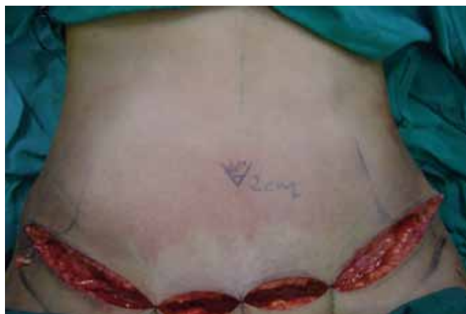
Figura 3 - Marcação prévia do local da incisão em “V” da neo-onfaloplastia.