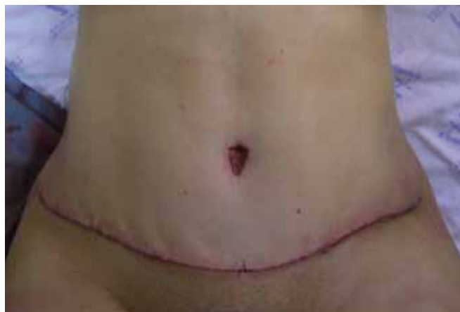
Figura 7 - Pós-operatório imediato.