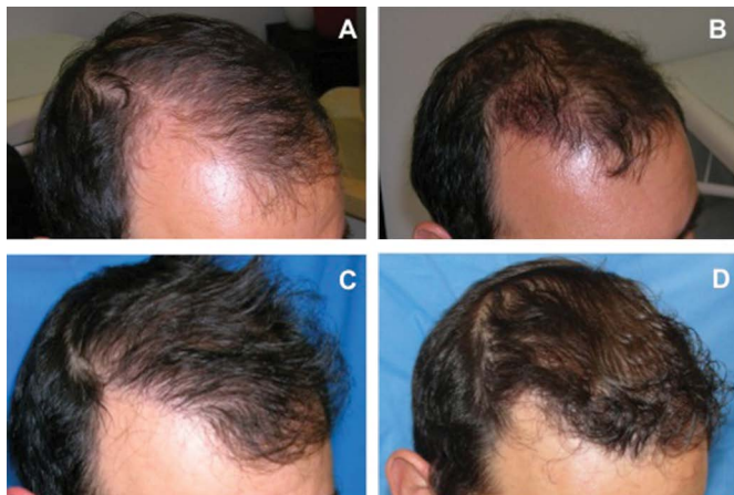
Figura 2. Paciente do sexo masculino, com 39 anos de idade, com alopecia grau III, submetido a 1 sessão de transplante capilar de 1527 UF. A : pré-operatório. B : pós-operatório de 3 dias. C : pós-operatório de 7 meses, D : pós-operatório de 1 ano. UF: Unidades Foliculares.