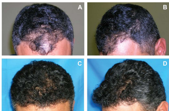
Figura 3. Paciente do sexo masculino, com 38 anos de idade, com alopecia grau IIA, submetido a 1 sessão com 900 UF. A e B : pré-operatório. C e D : pós-operatório de 1 ano. UF: Unidades Foliculares.