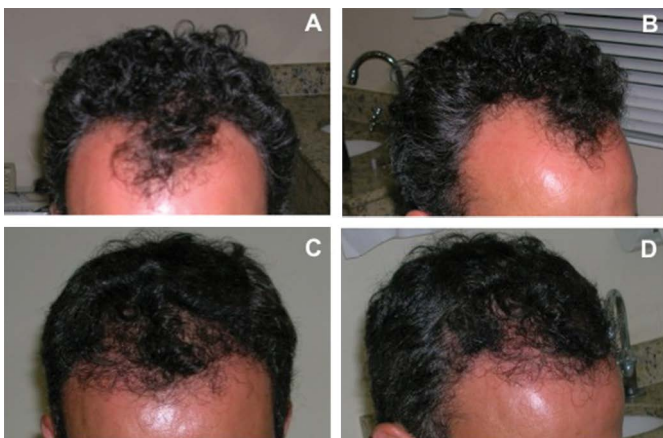
Figura 4. Paciente do sexo masculino, com 36 anos de idade, com alopecia grau III, submetido a 1 sessão com 1.227 UF. A e B : pré-operatório. C e D : pós-operatório de 1 ano. UF: Unidades Foliculares.