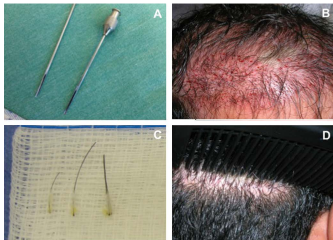
Figura 1. A: Cânulas modificadas. B: Aspecto da cirurgia. C: UF de 1, 2 e 3 fios. D: Aspecto da cicatriz com 6 meses. UF: Unidades Foliculares.

média de implantação, somando o tempo de realizar as incisões prévias e o tempo de implantação, foi de 182,3 UF's por hora (Tabela 1).