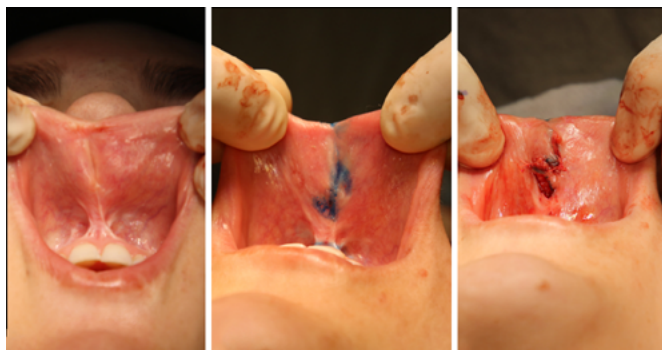
Figura 4. A e B. Marcação de zetaplastia em área de retração da mucosa do lábio superior; C. Transposição dos retalhos da zetaplastia.

No lábio superior, optou-se por zetaplastia da mucosa, permitindo avanço do vermelhão úmido e melhora da retração. Devido à persistência de falta de volume e projeção na região, foi associada uma lipoenxertia de 2ml, com resolução da deformidade em assobio (Figura 4).