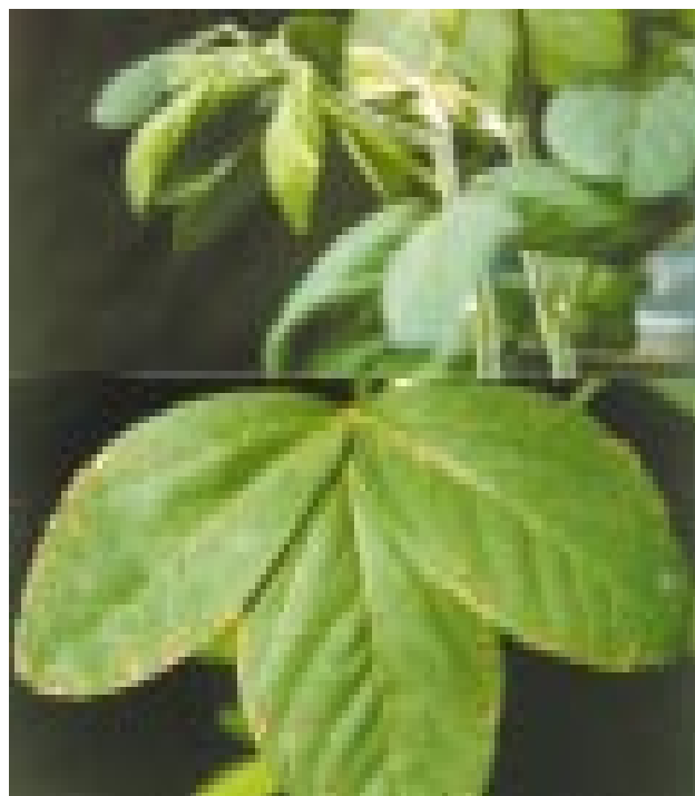
Figura 1. Sintomas observados de deficiência (acima) e toxidez (abaixo) de B em folhas de soja, respectivamente, nos tratamentos com 0,0 e 2,0 \text{ mg L}^{-1} de B na solução nutritiva.

A resposta dos cultivares de soja em produção de matéria seca (MS) total, dependendo das concentrações de B em solução, encontra-se na figura 2b (equações de ajuste no quadro 3). Ao contrário do que foi observado para a altura das plantas, houve melhor discriminação entre os cultivares avaliados quanto ao acúmulo de MS total. Exceto na ausência de B em solução, nos demais tratamentos, houve a seguinte ordem decrescente de cultivares na capacidade produtiva de MS total das plantas: IAC-8 > IAC-15 > IAC-17 > IAC-1. Como aconteceu para a altura das plantas, também a