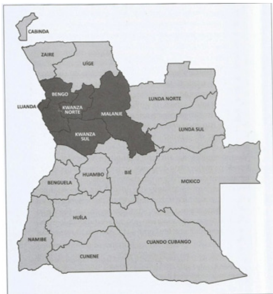
Figura 2 Mapa de Angola com Destaque para as Regiões Kimbundu Descritas por Xitu em Vozes na sanzala