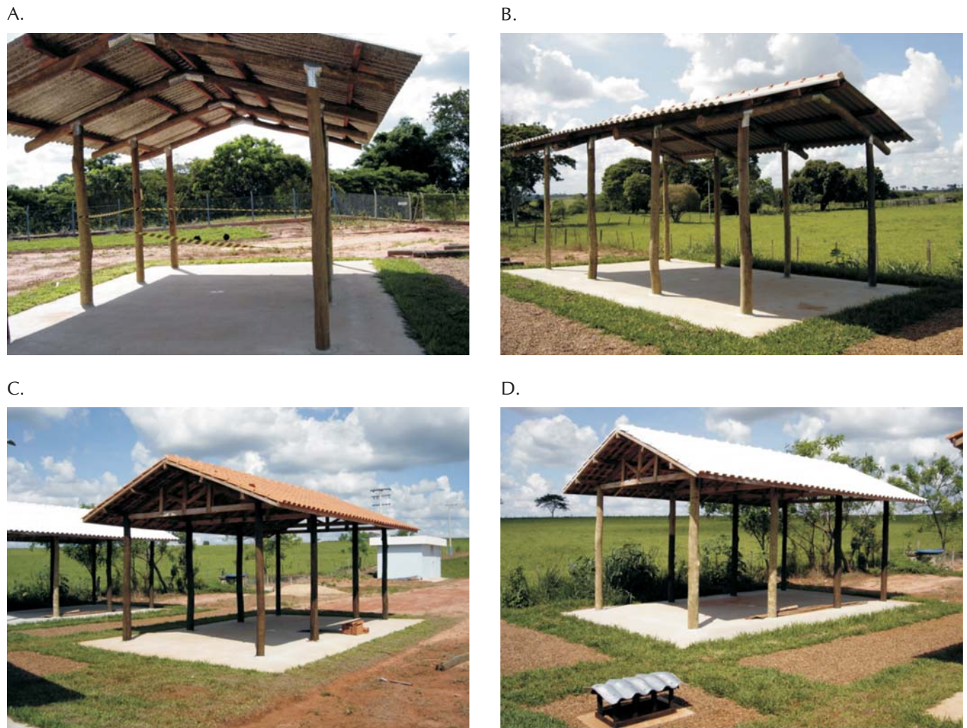
Figura 1. Protótipos avaliados: Telha reciclada (A), Telha fibrocimento (B), Telha cerâmica (C) e Telha cerâmica pintada de branco (D)

utiliza caixas do tipo tetrapack em sua composição e apresenta largura útil de 860 mm, largura total de 920 mm, comprimento de 2200 mm, espessura 6 mm e peso de 14 kg (Figura 2).