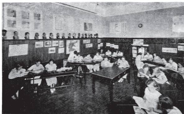
Figura 5: Alunos da Escola de Professores em aula de Sociologia.