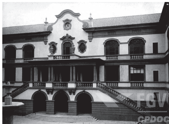
Figura 1: Aspecto interno do prédio do Instituto de Educação do Rio de Janeiro