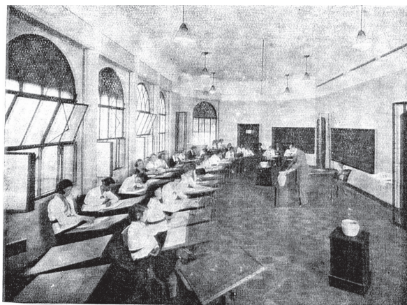
Figura 4: Sala-ambiente de Desenho