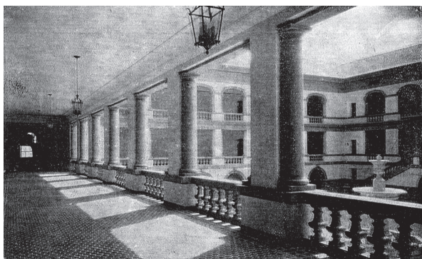
Figura 7: Vista do segundo pavimento do prédio