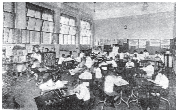
Figura 3: Aspecto de uma sala de aula da Escola Primária do Instituto de Educação