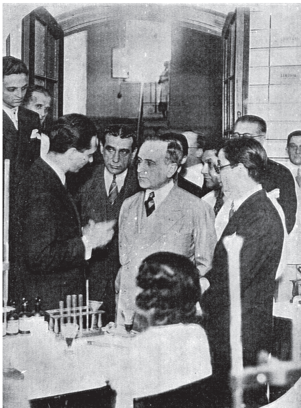
Figura 2: O presidente Vargas no Instituto de Educação