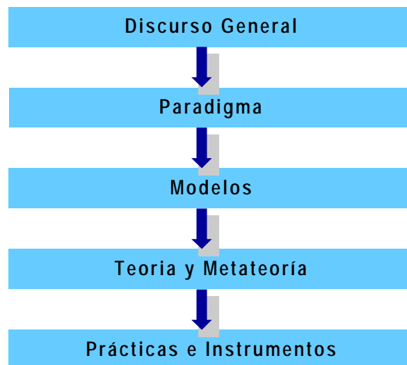
Figura 2. Marcos de significado (reproducido de Stangvik, 1998, p. 140)

El modelo de “marcos de significado” propuesto por Stangvik (1998) describe las bases sociales de la objetivación o modos en que pueden hacerse objetivas la discapacidad y la desviación normativa mediante dicha negociación del significado. Los significados en torno a éstos y otros conceptos se construyen en diferentes marcos de conocimiento y niveles que se organizan formando una estructura jerárquica interrelacionada: “discurso general”, “paradigma”, “modelo”, “teoría y metateoría” y “prácticas e instrumentos”.