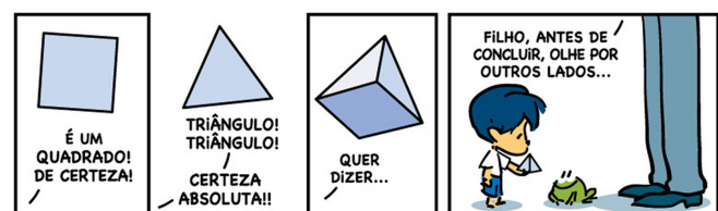
Figura 1: Tirinha. Retirada do site: https://tirasarmandinho.tumblr.com/ .

No primeiro quadro temos o análogo ao estudo de um mini caso, representado por um quadrado. No segundo quadro, temos um mini caso diferente, porém relacionado, representado por um triângulo. Ambos os mini casos compartilham os mesmos temas de análise conceitual – ângulos e segmentos de retas – mas diferem