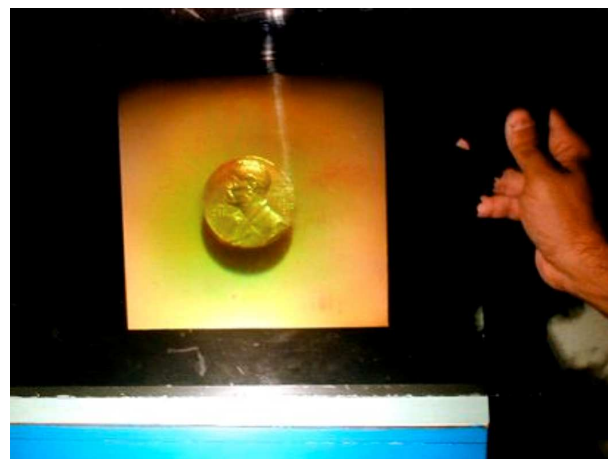
Figura 1 - Holograma de la medalla del Premio Nobel de Ernest Hemingway producido en Cuba.

Componentes del proceso pedagógico, que pueden ser utilizados por profesores y estudiantes, con el empleo o no de variados mecanismos y recursos, que partiendo de una relación orgánica con los objetivos y métodos sirven para facilitar el proceso de construcción del conocimiento, su control, el desarrollo de hábitos, habilidades y la formación de valores. [20]