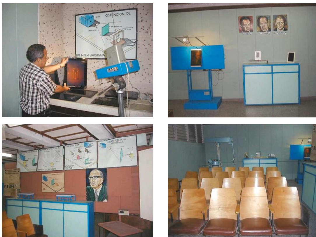
Figura 2 - Diferentes vistas de la Exposición Didáctica de Holografía.

En la Fig. 2 se muestran algunas vistas de la Exposición Didáctica de Holografía que se utiliza en la impartición de la disciplina física en las carreras de Ingeniería en el Instituto Superior Politécnico José Antonio Echeverría (CUJAE), La Habana, Cuba.