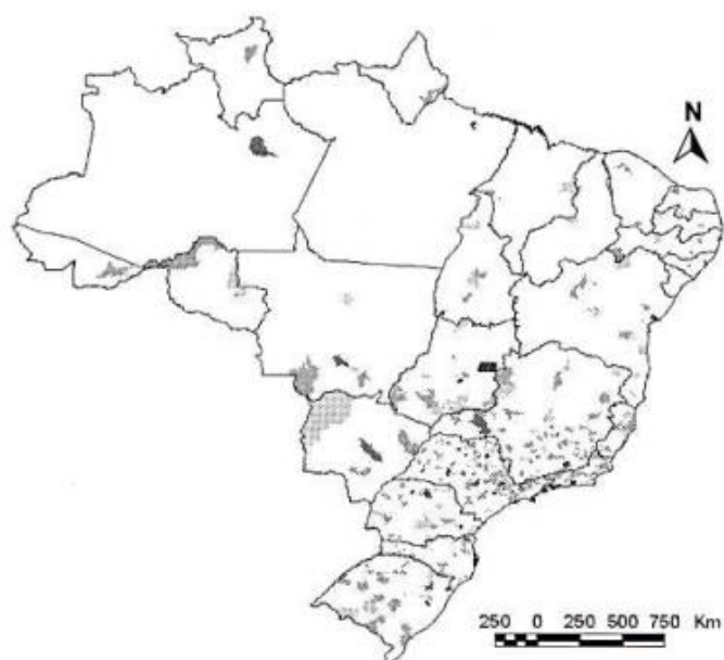
Mapa 3 Distribuição dos urologistas existentes no país – Brasil – 1997