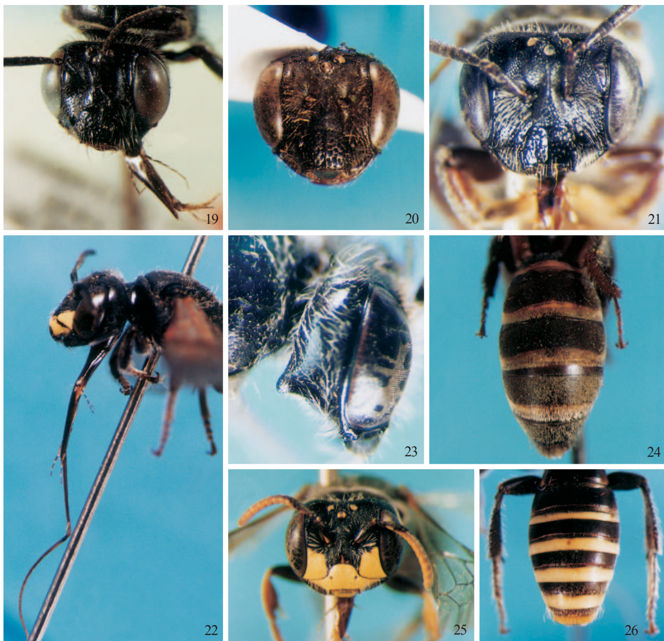
Figs. 19-26. Vista frontal da cabeça de (19) Anthrenoides corrugatus , fêmea; (20) A. densopunctatus , fêmea; (21) A. meloi , fêmea; (22) cabeça e mesossoma de A. admirabilis , macho; (23) perfil da cabeça de A. faviziae , macho; (24) tergos de A. langei , fêmea; (25) vista frontal da cabeça de A. micans , macho; (26) tergos de A. admirabilis , macho. Figs. 19-20, 22-26, holótipos; fig. 21, parátipo fêmea.

interalveolar alongada e em forma de gota, fôveas faciais rasas, mesoscuto micro-reticulado e o escutelo polido.