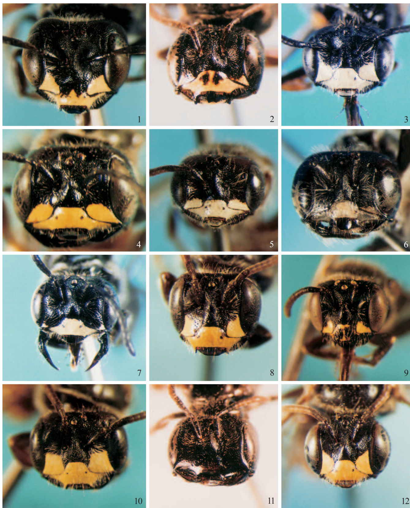
Figs. 1-12. Vista frontal da cabeça dos holótipos de: (1) Anthrenoides admirabilis ; (2) A. albinoi ; (3) A. antonii ; (4) A. araucariae ; (5) A. elegantulus ; (6) A. faviziae ; (7) A. guarapuavae ; (8) A. larocai ; (9) A. magaliae ; (10) A. meloi ; (11) A. ornatus ; (12) A. palmeirae . Todos machos.