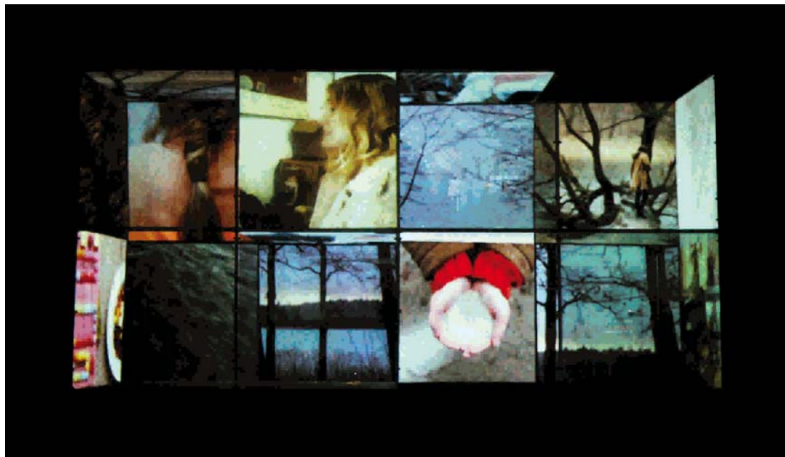
Figura 1 – Foto de cena de Distancia , de Matías Umpierrez.

A utilização do recurso streaming em Distancia revela uma alteração da relação tempo e espaço no convívio teatral. Há um compartilhamento da mesma coordenada temporal entre as atrizes e os espectadores. No entanto, há um alongamento tremendo da coordenada espacial. Compartilha-se um espaço real (o teatro e a casa das mulheres), mas esse espaço é dilatado e não permite, por exemplo, o toque. Ao não permitir o toque, chama-se a atenção para a distância que os separa, ainda que a imagem seja tão carregada de presença e seja transmitida em tempo real. É dessa distância que se queixam as atrizes, da distância entre seus amores, da impossibilidade do toque, da relação mediada pela tecnologia, do tecnovívio no lugar do convívio. Por meio dos hipervínculos trabalhados na obra, percebemos a ubiquidade da vida contemporânea mediada e, ao mesmo tempo, ressentimos o contato direto com o outro. Evidenciando as características de transteatralização das tecnologias de transmissão remota como o Skype , tecnologias que desterritorializam o diálogo, Distancia aponta para a impossibilidade de uma substituição absoluta da copresença em nossas relações.