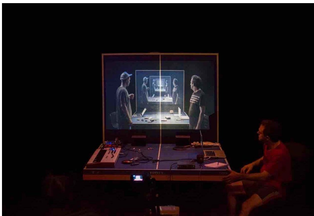
Figura 2 – Fotografia do espetáculo Las Ideas , de Federico León (à dir.).

Como em um espetáculo de um mago, o espectador vive em estado de pergunta: isso que aconteceu foi uma verdade ou uma atuação? Esse é o fio narrativo da obra, um fio narrativo abstrato e especulativo, quase sem ação, e por isso a obra se chama As Ideias .