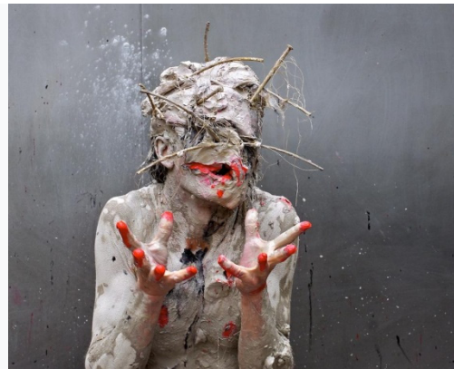
Imagem 3 – Mummenschanz: frame do vídeo Masks (1976).