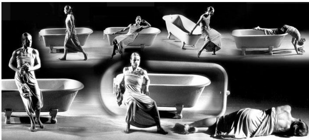
Imagem 5 – Susanne Linke: Im Bade Wannen (1980).

Começamos com o exemplo da primeira dimensão de objetos propositores, chamada de objetos prontos ou pré-existentes: a obra Im Bade Wannen (1980), de Susanne Linke. A artista não faz a banheira parecer uma personagem, mas lida com a banheira a partir das propriedades de seu material constitutivo. Artistas como Susanne Linke estabelecem um tipo de jogo simbiótico com o objeto por meio de um processo de aproximação, reconhecimento e exploração do objeto escolhido. Im Bade Wannen (Imagem 5) é um exemplo de uma metodologia que não se restringe a emprestar vida ao objeto inerte, tampouco é uma tarefa de o ressignificar pelo uso. O próprio objeto da banheira apresenta uma restrição a essa abordagem – é possível manipular quase tudo, mas, para uma pessoa manipular uma banheira, há que se lidar com os elementos restritivos do tamanho, da forma e do peso. Antes, deve-se estabelecer um processo de percepção com esses elementos constituintes do objeto.