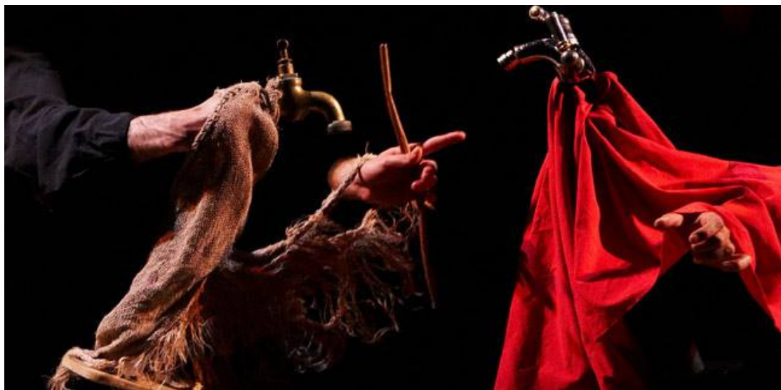
Imagem 2 – Tábola Rassa: El Avaro .

Outro princípio a ser pensado, nessa ideia de objeto dócil que estamos construindo, relaciona-se à metáfora. Quando é atribuído a um objeto um sentido diferente do seu uso ou concepção original, podemos estar constituindo uma metáfora. Assim, uma cadeira poderá ser transformada em um escudo ou uma coroa. Talvez esse seja o princípio que parece mais se aproximar da aceção de teatro de objetos que transforma as coisas em personagens. Por exemplo, o objeto bacia pode ser considerado dócil se tomarmos a sua utilidade previamente estabelecida. Pode ainda ser transformada metaforicamente em um personagem. Há muitos exemplos desse tipo de abordagem, mas traremos como exemplo a montagem da obra Avarento , de Molière, pelo grupo espanhol Tábola Rassa. A metáfora criada foi profícua na montagem, em que o tesouro da personagem com característica avarenta era a água que era conferida com um conta-gotas: cada gota era contada como se fosse uma moeda. Dessa forma, as características das personagens apresentadas como torneiras variavam de acordo com o seu tipo. Por exemplo, a mocinha da história era uma torneira com acabamentos delicados e da cor dourada. Já o Avarento , na Imagem 2, era uma torneira mais rústica.