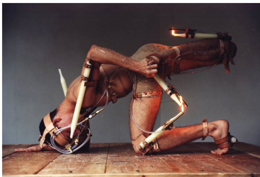
Imagem 7 – Michel Groisman: Transferência (2011).

Por fim, chegamos ao terceiro exemplo de objetos propositores construídos: a obra Transferência , do artista brasileiro Michel Groisman. O artista cria uma estrutura associada ao seu corpo, uma espécie de prótese com velas presas próximas das articulações do seu corpo e tubos que saem da boca do artista indo até o pavio das velas. Por meio desse elemento, associado ao corpo, o performer transfere e mantém uma única chama acesa dessa espécie de exoesqueleto, ao qual seu corpo está fisicamente unido. Esse corpo-armadura ultrapassa a ideia de objeto, assemelha-se mais a um dispositivo que o artista utiliza para produzir uma partitura de movimentos que obedece a um rigoroso princípio lógico, cujo objetivo é a transferência da chama. Tal procedimento impõe uma lógica corporal única, em que a interdependência entre o objeto e o corpo do artista são irrevogáveis.