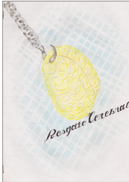
Imagem 3 – Desenho intitulado Resgate Cerebral após a sua participação, 2008. Desenho do Monitor R.

O ato de possibilitar os jogos dentro de um sistema carcerário favoreceu para eles uma reflexão acerca do seu corpo aprisionado e, portanto, a discussão de “[...] uma grande mutilação do eu” (Goffman, 1987), isto é, o desculturamento, o despir de si, a padronização, a degradação, a humilhação, a profanação e os rituais de admissão 8 , que, de certa forma, podemos apreender no desenho abaixo, Resgate Cerebral , criado por um dos monitores: