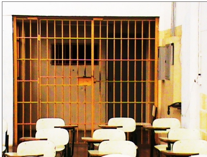
Imagem 1 – Entrada para o Galpão Escola do Presídio, 2009. Ensaio Fotoetnográfico.

Mas, para estar lá, era preciso que um agente penitenciário me acompanhasse até um segundo portão, imenso, com um enorme cadeado, para ser revistado por outro agente de cima para baixo e somente depois chegar ao Galpão. Mais uma vez, abria-se outro portão e outra grade de ferro, de cor amarela, para de fato adentrar no espaço chamado Galpão Escola do Presídio, conforme mostra a imagem abaixo: