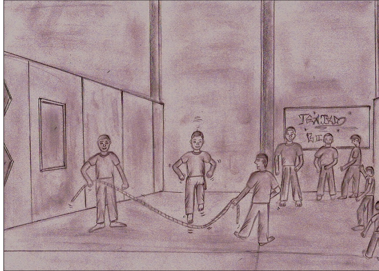
Imagem 4 – Oficina d’O Brincar com Teatro: pular corda, 2008. Desenho do Monitor RSG.

Os jogos tradicionais foram desenvolvidos em várias sessões, sendo distribuídos entre jogos e cantigas , porém experimentando junto a eles outras regras desse jogar, como, por exemplo: escravo de Jó, pai Francisco, cabra-cega, amarelinha, Terezinha de Jesus, boca de forno, pula corda, durinho, arlequim, a canoa virou, queimada etc., que proporcionavam investigar as regras preestabelecidas e o prazer do jogar e modificar as regras e, diante disso, o despertar do seu próprio corpo, isto é, a alegria, a satisfação, o tocar, o respeitar o outro e o estar-junto nesse espaço carcerário: