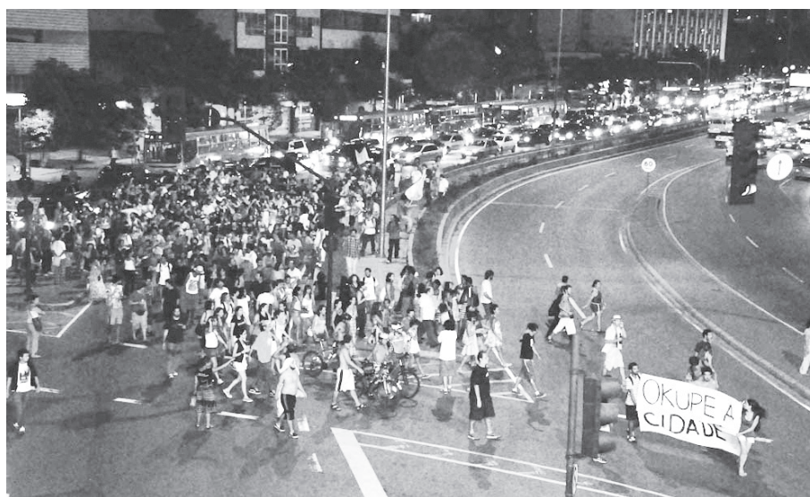
Figura 1: Primeiro Eventão Praia da Estação, Avenida dos Andradas, 6 de março de 2010