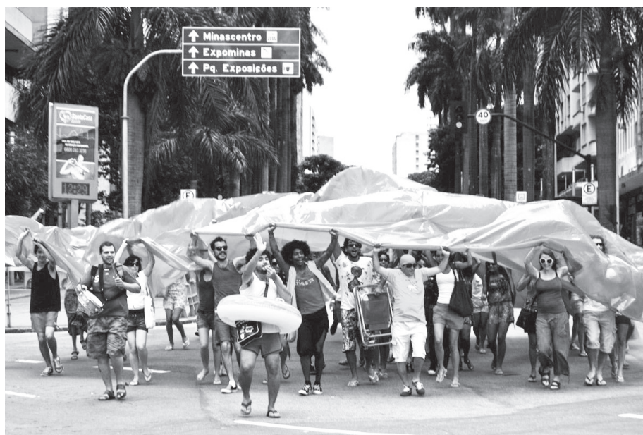
Figura 2: Aniversário de um ano da Praia da Estação, Avenida Amazonas, 23 de janeiro de 2011