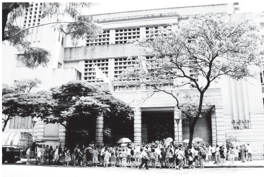
Figura 3: Lavagem das escadarias da Prefeitura de Belo Horizonte pelo Bloco da Praia da Estação, Avenida Afonso Pena, 5 de março de 2011

Fonte: Fotografia de Flávia Mafra (2011).