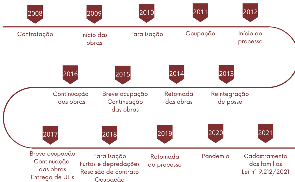
Figura 2. Linha do tempo da execução do Residencial Liberdade

do escritório que desenvolveu o projeto; um técnico de empresa que participou da execução da obra. Antes do início das entrevistas, a pesquisa obteve parecer favorável do Comitê de Ética em Pesquisa da Plataforma Brasil.