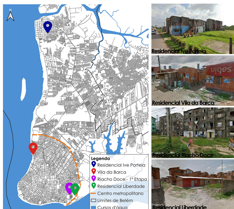
Figura 3. Residenciais ocupados irregularmente em Belém

irregularmente após terem suas obras paralisadas. Esses conjuntos habitacionais são: Residencial Ive Portela, que integra a macrodrenagem na Bacia do Paracuri; Residencial Vila da Barca, que integra a urbanização do assentamento homônimo; Residencial Riacho Doce e Residencial Liberdade, ambos integrando a macrodrenagem da Bacia do Tucunduba (Figura 3). Todas essas intervenções se localizam nas baixadas de Belém – áreas com cota altimétrica de até 4 metros, entrecortadas por rios, inseridas no atual centro metropolitano, ocupadas por população de baixa renda (SUDAM; DNOS; PARÁ, 1976).