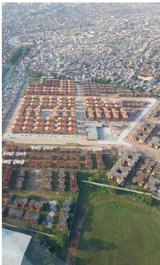
Figura 5. Foto aérea do Residencial Liberdade*

Após a área ter sido desocupada, as obras foram retomadas, mas novamente passaram por diversos problemas ao longo do tempo, como dificuldades para emitir o licenciamento ambiental (gerando paralisação das obras) e eventos de roubos e depredações no canteiro em 2017. No final desse ano, foram finalizadas e entregues as primeiras 288 UHs do Residencial Liberdade, de um total de 2.336, as únicas finalizadas até 2022 (Figura 5).