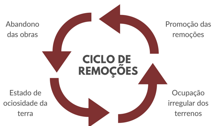
Figura 1. Ciclo de remoções