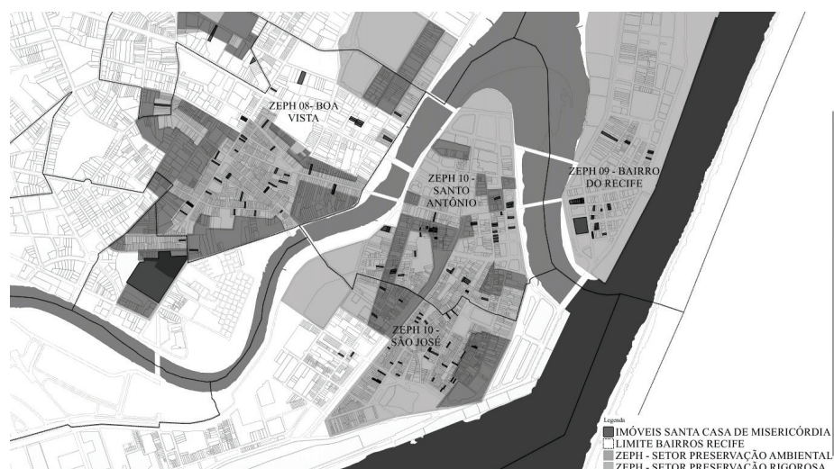
Imagem 1 – Mapa de localização dos imóveis da SCMR no CHR – 2017

Elaboração: Primavera, 2018.