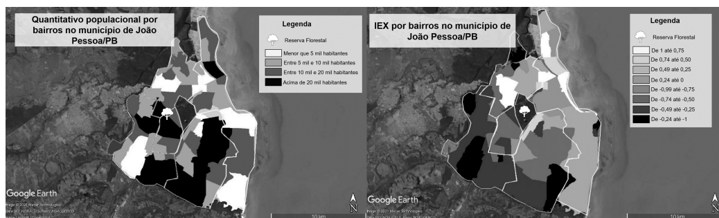
Mapa 1. Distritos Sanitários de João Pessoa com bairros mais populosos (2010) e áreas com piores condições socioeconômicas (2000)

Os dados da Tabela 2 evidenciam extremos da desigualdade social, explícita entre o bairro Paratibe, no DS III, com IEX -0,95 , e o bairro Aeroclube, no DS V, com IEX 1,0 . O Mapa 1, a seguir, mostra que os DS com bairros mais populosos concentram as áreas com piores condições socioeconômicas. Assim, é nítida a vulnerabilidade social que incide sobre os moradores de regiões mais populosas, identificando as localidades mais e/ou menos privilegiadas.