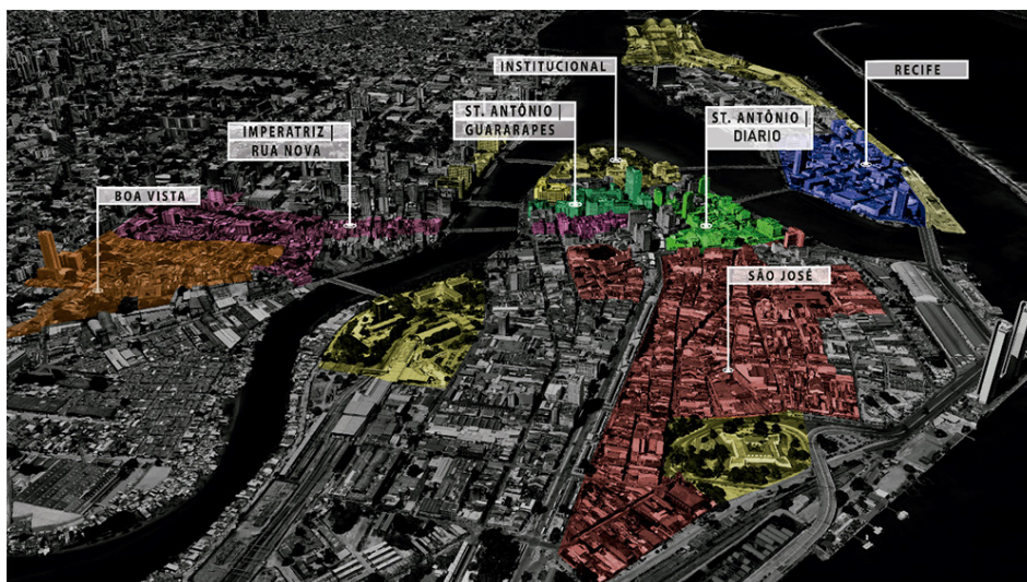
Figura 2. CHR: submercados imobiliários.

Cabe registrar que a pesquisa MICH havia identificado quatro submercados imobiliários no CHR. Tratava-se de uma primeira aproximação. Porém, sabia-se que os limites de cada um não coincidiam com as fronteiras dos bairros. O primeiro passo foi, então, mapear os padrões de ocupação e identificar os usos predominantes. Cada padrão de ocupação foi identificado com base na síntese entre os tamanhos/formatos dos lotes e as tipologias edilícias predominantes. O resultado da análise evidenciou uma relação estreita entre padrão de ocupação e uso, derivando-se em seis submercados (Figura 2), assim nomeados: Bairro do Recife, Santo Antônio-Guararapes, Santo Antônio-Diário, São José, Imperatriz-Rua Nova e Boa Vista. A área delimitada como institucional – embora nela se encontrem estabelecimentos comerciais e de serviços – foi descartada da análise em virtude da ampla presença de órgãos públicos (Palácio do Governador, Tribunal de Justiça, Teatro Santa Isabel, Antiga Estação Central do Recife).