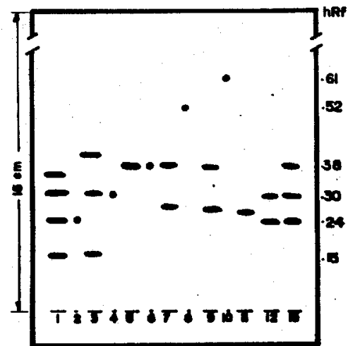
FIGURA 1 - Cromatograma (CCD) dos compostos antracênicos de Cassia fastuosa e Senna alexandrina .