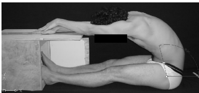
Figura 2. Teste sentar e alcançar com a porta aberta.

Os dois avaliadores avaliaram as mesmas 100 fotos (duas por participante – uma com PF e a outra PA), simultaneamente, em dois computadores independentes (interobservador). Para avaliação intra-observador, as mesmas fotos foram avaliadas com intervalo de cinco dias.