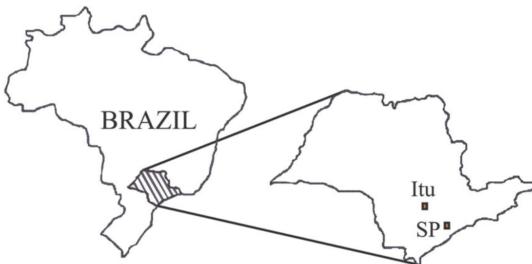
Figura 1 – Mapa de localização esquemático da área de estudos no Estado de São Paulo.

Os lineamentos retilíneos mais importantes que afetam os corpos granitóides apresentam orientação segundo os quadrantes NE e NW, onde são abundantes as direções preferenciais de N20-30E e N45-50W. Esses lineamentos representam geologicamente as zonas de falhas/fraturas, que são importantes estruturas para a exploração de águas subterrâneas em rochas graníticas. A Figura 1 mostra um mapa de localização esquemático da área de estudos.