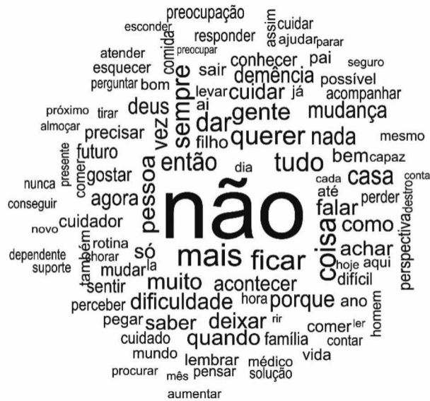
Figura 2. Frequência de palavras analisadas no conteúdo dos familiares cuidadores do Centro Multidisciplinar do Idoso do Hospital Universitário de Brasília. Brasília, DF, 2018.