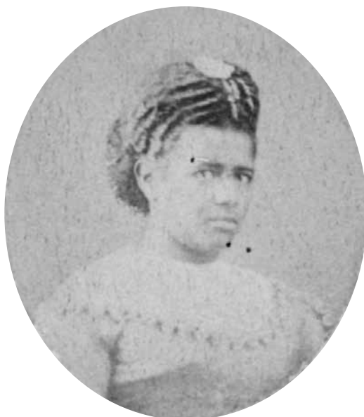
Figura 3 – Militão Augusto de Azevedo, 1879. Museu Paulista (MP).

Nesse sentido, apesar de apresentarem recorte, ângulo, direcionamento, distância e iluminação diferenciados entre si, os retratos de “tipos humanos” e as vistas e paisagens se assemelham por buscarem atender a nova modalidade de consumo inerente à sociedade moderna: o turismo (Brizuela, 2012). Considerada como um analogon da realidade no Oitocentos, a fotografia possibilitou o conhecimento visual de lugares, pessoas e culturas distantes, anteriormente inacessíveis à maioria da população, dando uma sensação de “aproximação do mundo” (Süssekind, 1990). Com o avanço da indústria do