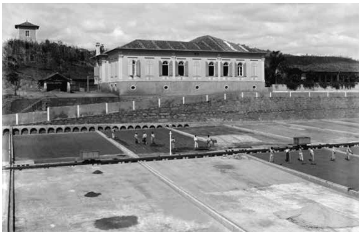
Figura 1 (tema 1) – Fazenda Cachoeira Grande, Rio das Flores. Marc Ferrez, década de 1880. Col. Gilberto Ferrez, IMS.