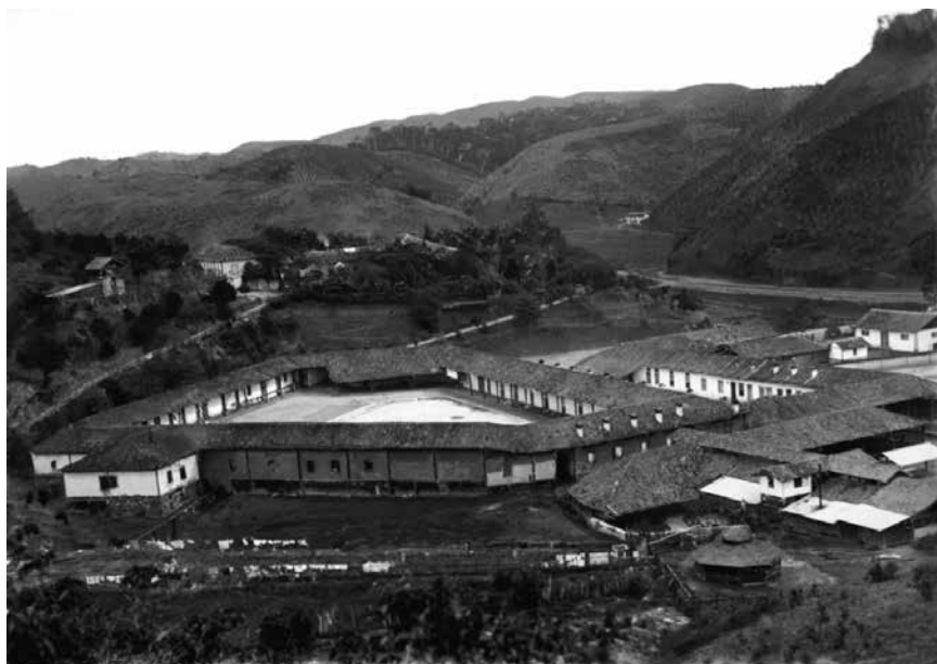
Figura 6 (tema 1) – Fazenda Santo Antônio do Paiol, Valença. Marc Ferrez, década de 1880. Col. Gilberto Ferrez, IMS.

Em termos técnicos, a imensidão com que as construções foram representadas por Ferrez para o tema 1 valorizava a capacidade produtiva, tecnológica e de expansão territorial das propriedades elencadas, demonstrando todas as suas potencialidades econômicas no presente e no futuro. Para dar o mesmo efeito, quando possível, Ferrez também enquadrava o maquinário externo disponível, a exemplo dos vagões sobre trilhos para o transporte interno do produto (Figura 1) ou do sistema de canaletas suspensas para remoção e lavagem dos grãos. Assim, o Vale do Paraíba era representado como uma região portadora de estrutura agrícola sólida e duradoura, reforçando sua identidade como maior exportador mundial de café e demarcando seu meio de inserção na sociedade moderna.