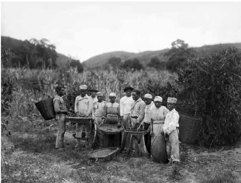
Figuras 8 e 9 (tema 2) – Marc Ferrez, década de 1880. Col. Gilberto Ferrez, IMS.