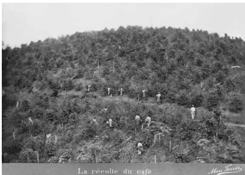
Figura 7 (tema 2) – Colheita do café . Marc Ferrez, década de 1880. Col. Thereza Christina Maria, BN.

relacionadas ao tema “quadrilátero funcional”, a linguagem fotográfica foi a das vistas e panorâmicas, especialidade de Ferrez. Para tanto, usou tomadas de longa distância, apresentando um registro telescópico de seus referentes. O efeito obtido espraiava a presença humana, esvaziava a importância das vivências individuais e mimetizava os cativos no ambiente retratado. Privilegiava-se a paisagem (natural ou construída) ao invés do homem, com a clara intenção de mostrar a grandiosidade das edificações e da paisagem com base na pequenez da escala humana.