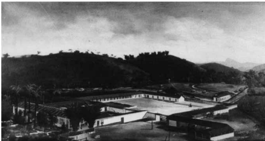
Figura 5 – Fazenda das Antinhas, Bananal. José de Lima, óleo sobre tela, século XIX. Coleção particular Família Almeida/Vallim.

circundada por um horizonte de montanhas cujo recorte se desenha com facilidade, a casa espaçosa e branca avulta dentro de um terreiro de trezentas e onze braças de circunferência! É o maior que tenho visto. Esta imensa praça é fechada em torno pelas senzalas, engenho e mais oficinas, de modo que forma uma larga cidadela para onde se entra por dois grandes portões laterais. As senzalas, caiadas todas e construídas uniformemente, destacam-se, bem como a casa, do verde graduado das florestas, e dão a esta propriedade um aspecto novo e agradável ... É uma cidade em ponto pequeno, onde se cultivam muitos ramos de indústria e se põem em movimento todas as gradações do trabalho. (Zaluar, 1859, p.29)