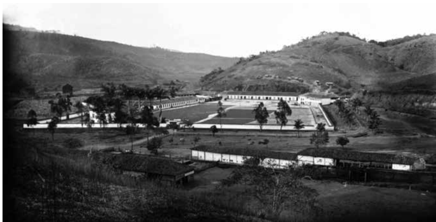
Figura 4 (tema 1) – Fazenda Campo Alegre, Valença. Marc Ferrez, década de 1880. Col. Gilberto Ferrez, IMS.

(Muaze, 2015). Para tanto, Marc Ferrez privilegiou as tomadas de longas distâncias, os enquadramentos horizontais e centralizados, os planos inferior e médio que destacavam os amplos limites e a topografia da paisagem, como se verifica nos exemplos das Figuras 4 e 6. A solução encontrada era própria das vistas, onde aciona um recurso de representação já testado em outras obras que permite uma visão de conjunto com destaque para o objeto central: a fazenda de café e seu entorno (Carvalho, 1998). Como resultado, a fazenda como paisagem construída torna-se objeto de apreciação estética.