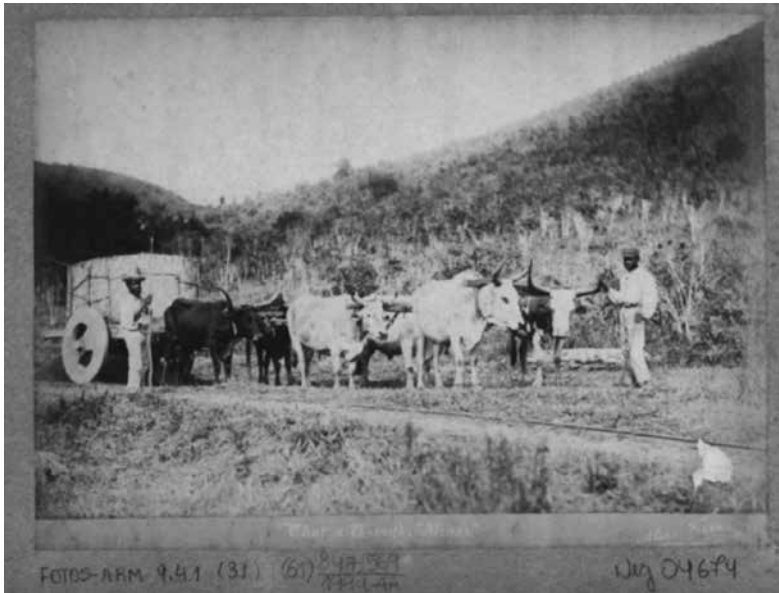
Figura 12 (tema 4) – Carro de boi em Minas . Marc Ferrez, década de 1880. Col. Thereza Christina Maria, BN.