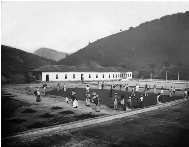
Figura 14 – Fazenda não identificada. Marc Ferrez, década de 1880. Col. Gilberto Ferrez, IMS.

atentar para o fato de que a Figura 12 é a melhor de um microconjunto de três imagens e, por isso, foi a escolhida para reprodução com assinatura do fotógrafo, venda e maior veiculação pela Marc Ferrez & Cia. Nas duas outras fotos, alguém sempre virava a cabeça, esquivando-se da representação ideal. Portanto, assim como nos retratos de estúdios urbanos ou de profissionais volantes que circulavam pelo Vale do Paraíba no século XIX, a pose e os diferentes posicionamentos no espaço de figuração eram essenciais para a construção da representação desejada tanto pelo fotógrafo quanto pelo fotografado, a despeito da hierarquia de poder existente entre eles.