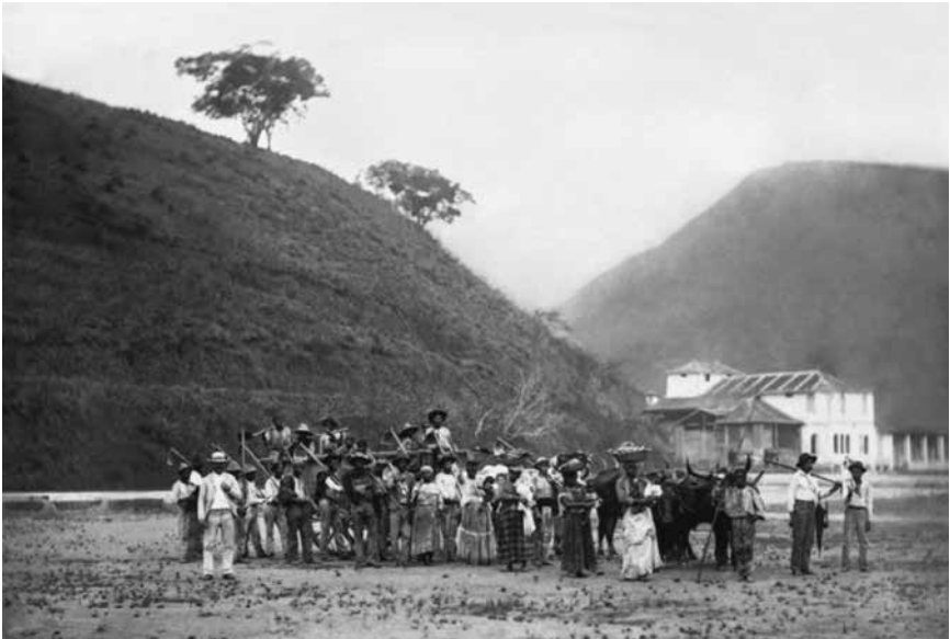
Figura 11 – Marc Ferrez, década de 1880. Col. Gilberto Ferrez, IMS.

1997; Slenes, 1999; Salles, 2008). Nas cenas retratadas (Figuras 10 e 11) é possível ver bebês no colo de suas mães escravas, em cestas de palha, amarrados aos corpos à moda africana, ou crianças agarradas na barra das saias de suas genitoras, gesto esse que talvez indicasse apreensão diante de um ato muito pouco comum no cotidiano das fazendas: posar para uma foto. Os homens eram a maioria dos trabalhadores retratados. Muitos portavam cestas, ceifadoras, enxadas, peneiras, varas e outros instrumentos de roça. As idades dos escravos eram bem variadas, aparecendo um número considerável de crianças e idosos legitimando o que o historiador Ricardo Salles chamou de “escravidão madura”, já que o Vale do Paraíba Fluminense teria conquistado estabilidade na taxa de natalidade escrava na década de 1860, o que lhe garantia mão de obra mesmo após o fim do tráfico, em 1850 (Salles, 2008).