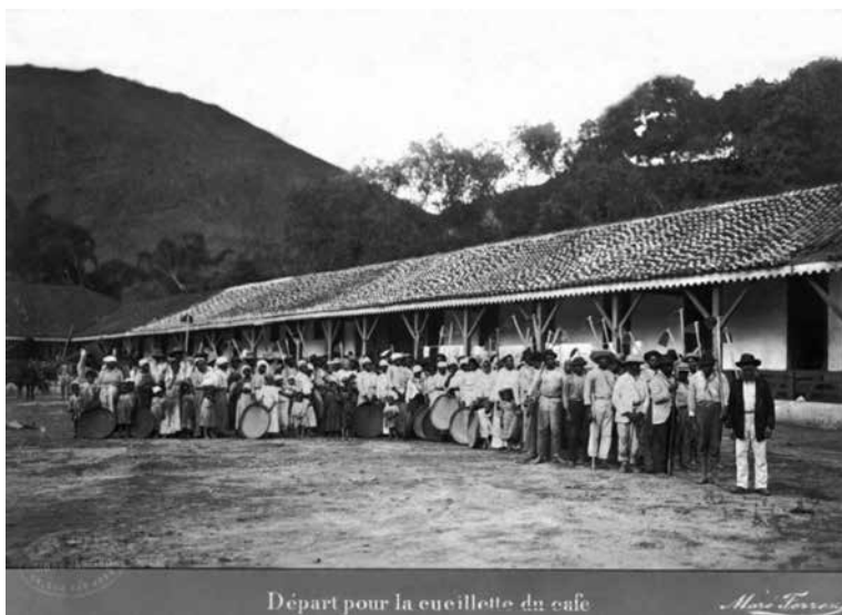
Figura 10 (tema 3) – Partida para a colheita do café. Marc Ferrez, década de 1880. Col. Thereza Christina Maria, BN.

A imagem evidenciada se constrói a partir da hierarquia feitor/capataz (primeiro da esquerda para a direita) e escravos. Levemente à frente, esse era o único homem a usar sapatos, símbolo de liberdade na sociedade imperial. Na arte, assim como na vida dos indivíduos ali representados, as relações escravistas cumpriam o papel de apartar e manter a hierarquia. O terreiro de macadame para a secagem do café e a senzala em linha coberta com telhas dirigiam os olhares para os avanços tecnológicos introduzidos na região do Vale e a solidez daquele complexo rural. Por sua vez, as condições da moradia escrava, arranjada em cubículos, com somente um portão e voltada para o terreiro, ficavam minimizadas pelo grande volume de pessoas em frente à construção. No plano superior, os morros mostravam um solo desgastado, erodido, que necessitava novas terras férteis, de tempos em tempos, para manter a produção em alta (Stein, 1961).