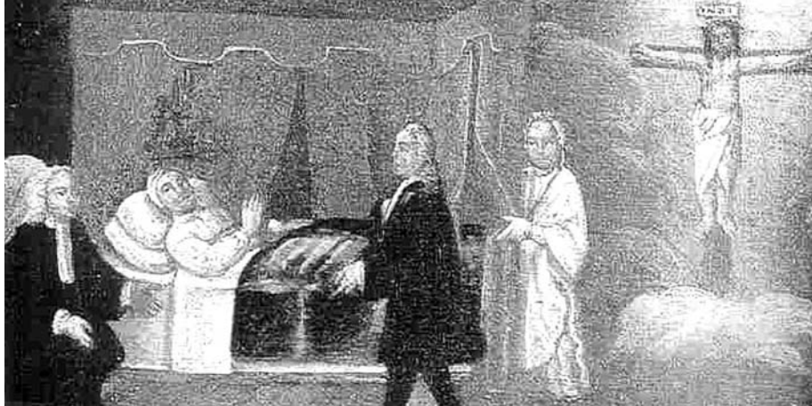
Figura 1: Extraída do catálogo de ex-votos Estórias de dor, esperança e festa. O Brasil em ex-votos portugueses, XVII-XVIII . Lisboa: Comissão Nacional para as comemorações dos descobrimentos portugueses, 1998.

imagem de um santo envolto em nuvens. 21 Apesar de certas diferenças com relação aos aspectos formais e da especificidade dos milagres representados, pode-se falar de um certo padrão de representação presente nas tábuas votivas, continuidade de uma tradição europeia e, sobretudo, portuguesa que viveu também no Brasil, conforme se pode comprovar a partir de exemplos dessas imagens (Figuras 1 e 2). 22