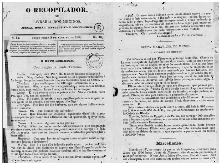
Figura 2 - O Recopilador , número 14, páginas 1 e 2, impresso no Rio de Janeiro.