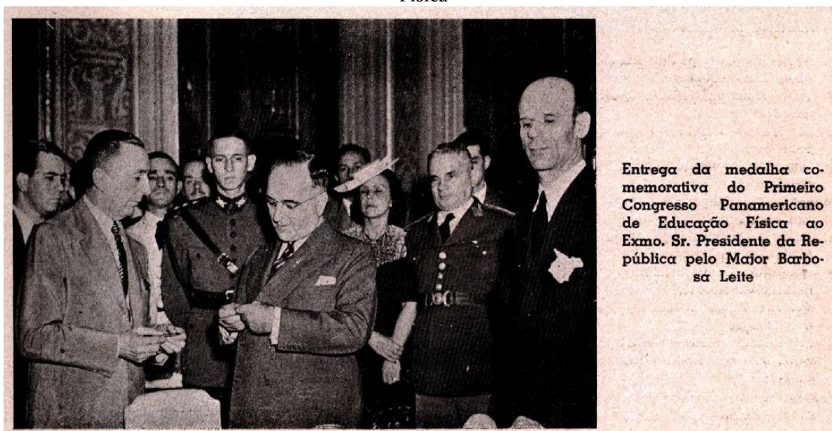
Figura 1 - El presidente de Brasil, Getulio Vargas, durante el I Congreso Panamericano de Educación Física

Fuente: O que foi o I Congresso... (1944, p. 21).