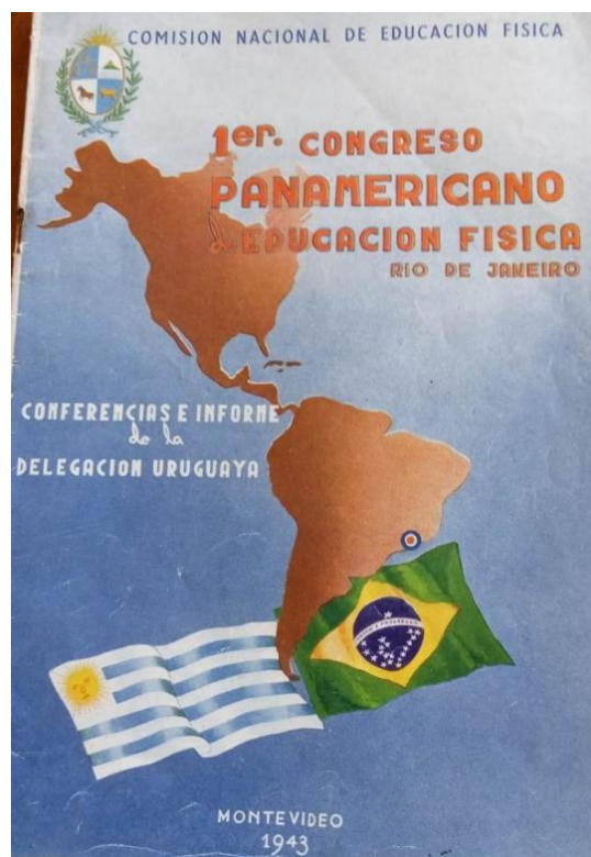
Figura 3 Informe oficial de los representantes uruguayos sobre el Primer Congreso Panamericano de Educación Física