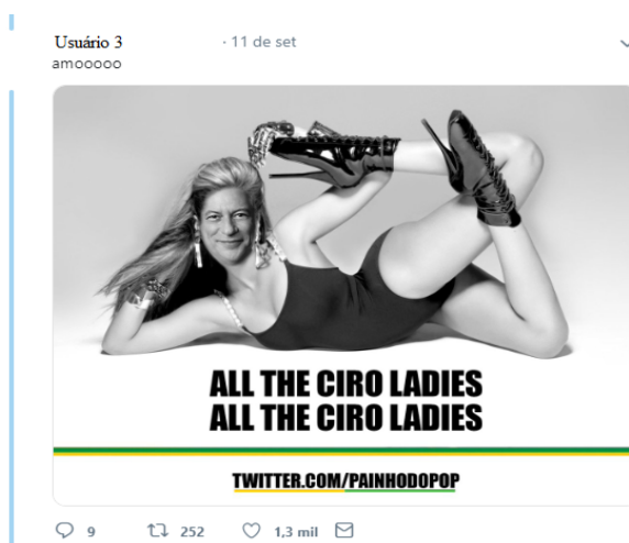
Figura 6 – Exemplo de interação que mistura a campanha de Ciro Gomes como música de Beyoncé