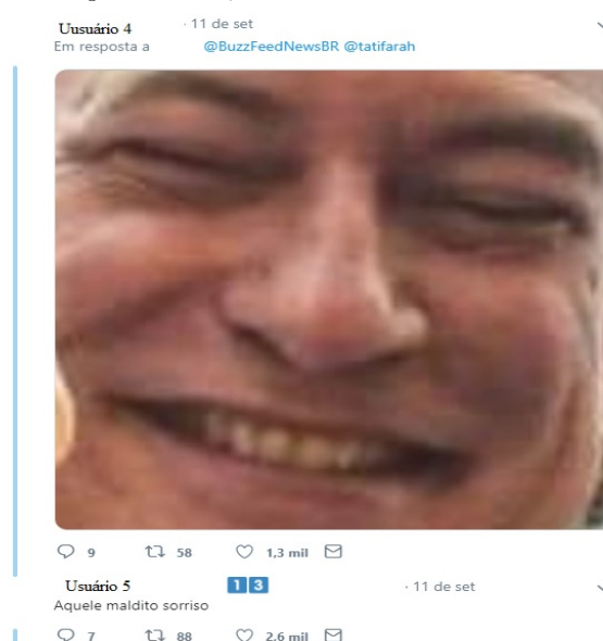
Figura 7 – Exemplo de interação sobre o meme “A, B ou C ou Beyoncé?”

Ainda entre as respostas de apoio ao político, aparecem comentários que retomam o meme presente no primeiro tweet aqui analisado ao congelar um frame do vídeo em que Ciro Gomes sorri (FIGURA 7). Um elemento interessante é que a imagem recebe a resposta de outro usuário (Usuário 5) que inclui o número 13 ao lado de seu nome no Twitter. Durante a campanha eleitoral, muitos usuários utilizaram números junto aos seus nomes para indicar apoio a algum dos candidatos. Neste caso, o 13 é o número do Partido dos Trabalhadores (PT), que teve como candidatos Lula, que acabou tendo sua candidatura impugnada, e Fernando Haddad, que foi ao segundo turno, mas não se elegeu. O Usuário 5 ainda tem a arte de apoio ao PT em sua foto de perfil – que foi anonimizada nesta análise –, ou seja, o usuário que responde a mensagem e reforça o sentido do meme é apoiador de outro candidato, mas acaba por se engajar positivamente no tweet de Ciro Gomes.