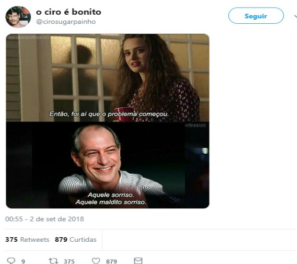
Figura 3 – Exemplo de mensagem do usuário “o ciro é bonito”

Como destacado na reportagem compartilhada no tweet analisado, o meme de Ciro como um sex symbol foi criado por indivíduos que o consideravam bonito. Esse tipo de manifestação gerou, inclusive, um perfil no Twitter, com a finalidade de reproduzir várias mensagens de conteúdos afins (FIGURA 3). Com isso, surgiram mensagens de diversos tipos, como fotos, montagens e até mesmo outras mais simples, apenas contendo texto verbal (sem imagens ou vídeos). Alguns desses exemplos podem ser vistos na reportagem mencionada no tweet 13 , os quais também apresentam a remixagem do meme.