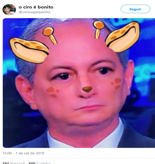
Figura 4 – Exemplo de justaposição do meme “Ciro sex symbol ” 15

Outra característica marcante do meme é o uso do humor (KNOBEL; LANKSHEAR, 2007), que, aqui, acaba por fortalecer a imagem de Ciro Gomes na rede, em função dos elementos simbólicos que evoca (FERREIRA, 2015) ao reforçar características físicas do candidato e o qualificar como símbolo sexual. O uso de justaposições (KNOBEL; LANKSHEAR, 2007) também é comum – como mostram os exemplos na reportagem e na Figura 2, e, principalmente, na Figura 4 (abaixo) –, ainda que não seja necessário na reprodução do meme, por ser menos central para sua circulação.