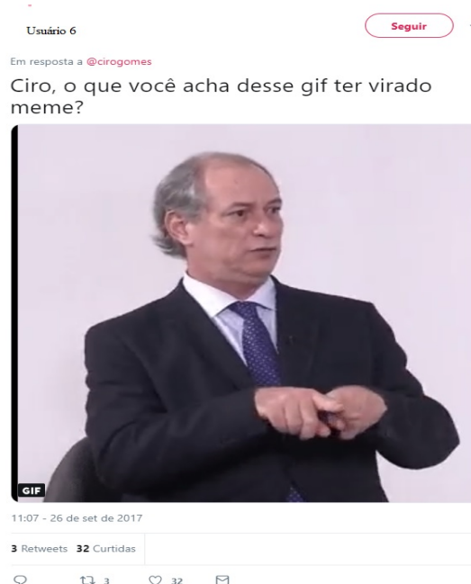
Figura 8 – Mensagem de 2017 que menciona o início do meme

O início da vida do meme está em um GIF 17 retirado de uma entrevista. A forma como Ciro gesticula foi o que primeiro chamou a atenção de usuários do Twitter. Já em 2017 o meme possuía alguma circulação na rede, como no exemplo abaixo (FIGURA 8) em que um usuário responde mensagem do próprio Ciro Gomes.