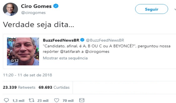
Figura 5 – Tweet “A, B ou C ou a Beyoncé”

O segundo tweet analisado (FIGURA 5) é de 11 de setembro e repercute o meme “A, B ou C ou a Beyoncé”. Assim como na primeira mensagem, para sua análise utilizam-se os quatro níveis da CMDA.