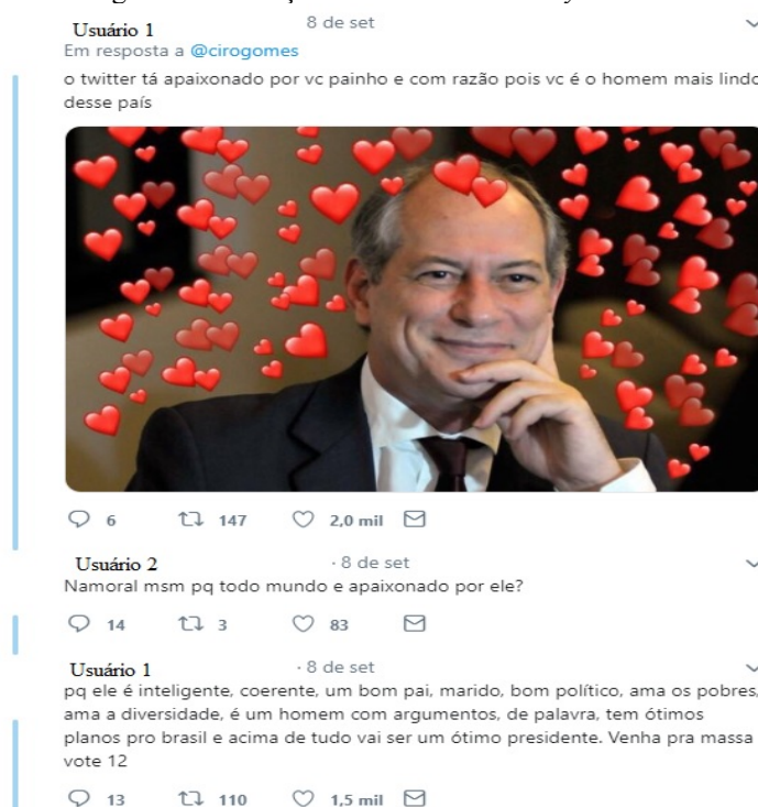
Figura 2 – Interação no tweet “Ciro sex symbol ”

As respostas ao tweet também reforçam a mensagem de humor e representam suporte ao então candidato à Presidência da República. Entre elas, é possível perceber que o sentido ultrapassa apenas o aspecto do humor e avança também para a persuasão política. Um dos exemplos, que inclusive reforça o meme de Ciro como sex symbol , pode ser visto abaixo.