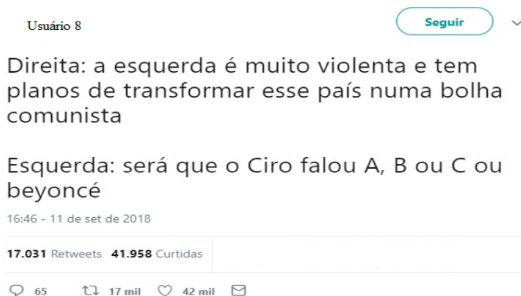
Figura 11 – Exemplo de interação sobre o meme “A, B ou C ou Beyoncé?”