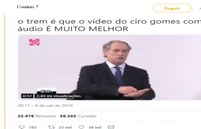
Figura 9 – Mensagem que destaca o áudio do vídeo

Com a campanha eleitoral em 2018, o GIF ganhou maior visibilidade na rede, e com a divulgação do vídeo acompanhado do áudio acabou por remixar (KNOBEL; LANKSHEAR, 2007) o meme inicial, gerando maior repercussão. Além disso, o GIF fortaleceu a história do meme devido a este novo tipo de replicabilidade na rede. Na Figura 9, por exemplo, o Usuário 7 destaca o áudio da entrevista, gerando grande repercussão – quase 23 mil RT e 60 mil likes , além de quase 2,5 milhões de visualizações. A partir do meme, que se utiliza apenas de um recorte, a entrevista do então candidato acaba ganhando visibilidade, pois muitos usuários assistem ao vídeo instigados pela curiosidade sobre o que teria sido dito por Ciro. Assim, o meme contribui para o espalhamento de uma entrevista de cunho político, mas de forma leve e mais palatável (FREUD, 1927) no contexto de disputa.