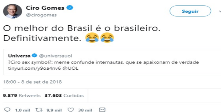
Figura 1 – Tweet “Ciro sex symbol”