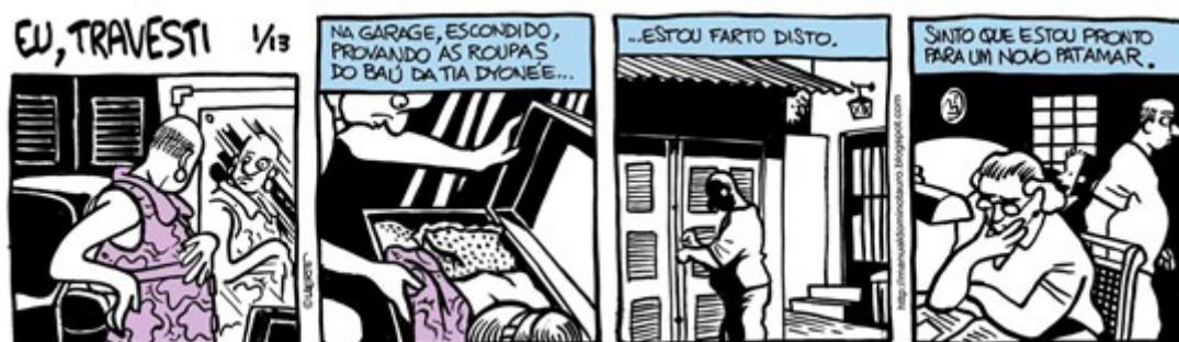
Figura 6 – Primeira parte da série “Eu, travesti”. Publicado em 3 de dezembro de 2008 no blog “Manual do Minotauro”.

Nessa história, há um uso de cores pontual, um vestido, um telefone, as esculturas, o quadro recitativo da história (espaço que ocupa o texto da narração). Uma leve cor em meio ao preto chapado preenchendo o fundo de cenas, em jogo de luz e sombras como pede essa história sobre clandestinidade. O quadrinho antecede sua adoção do termo “travesti” para designar-se a si mesma. Na entrevista concedida à Bravo! ainda falava em crossdresser , e começaria apenas no ano seguinte a frequentar clubes específicos para homens que desejam se vestir de mulher (ANTENORE, 2010).