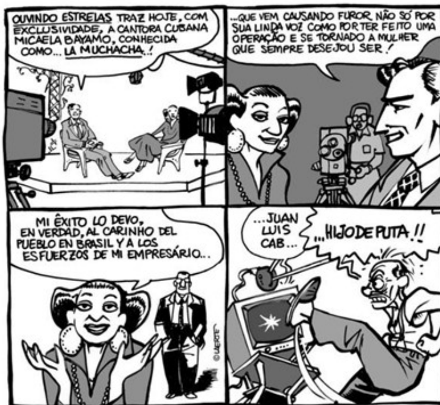
Figura 1 – Muchacha , p. 62.

“Muchacha” surgiu no jornal em “quadrões”, em um espaço do jornal em que as tiras eram dispostas na forma de um quadrado de quatro quadros (Figura 1) – apenas uma alteração espacial ajustando-se a um espaço pré-definido editorialmente, mas que auxiliou na relação das narrativas à ideia de tela de uma TV, com o aspecto de antigo remetido pelos tons de cinza. O mesmo espaço havia sido ocupado anteriormente por uma série intimista, também em homenagem à televisão, e que também seria reunido em livro: Laertevisão (COUTINHO, 2007). Nela, ela descrevia a si mesma (ainda no masculino) entre a infância e a maturidade, diante da tela de uma TV. Laerte participou da primeira geração que cresceu diante da telinha e, nesse livro, elas nos apresenta essas memórias entremeadas com desenhos da infância, cenas lembradas, recortes de jornais de época e mistura entre sonho e realidade.