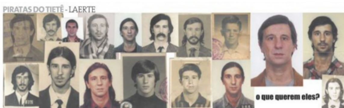
Figura 4 – Tira publicada na Folha de S. Paulo em 29 de agosto de 2006.

(se) perguntava sobre desejo: “o que querem eles?”. Desejos de si mesma que já esqueceu, tantas versões de si, tantos querereres.