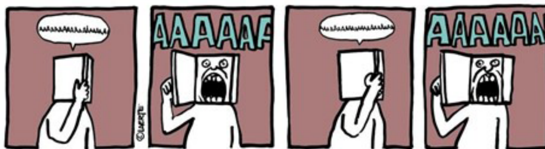
Figura 5 – Tira no blog Manual do Minotauro de 16 de fevereiro de 2013.

Essa encenação do corpo traz fagulhas reais de um sujeito (o biografema, como cunhou Barthes), que participa do tecido dessa Obra nova, um novo rumo de uma “Vita Nova” à la Dante, que ela começou a tecer por volta dessa época: uma Obra de fragmentos poéticos em quadrinhos, em que o corpo é explorado como personagem e na plasticidade do desenho. Corpo, desenho e palavra dançam e fascinam: a Figura 5, por exemplo, joga com o absurdo, uma imagem insólita de corpo e som desenhados.