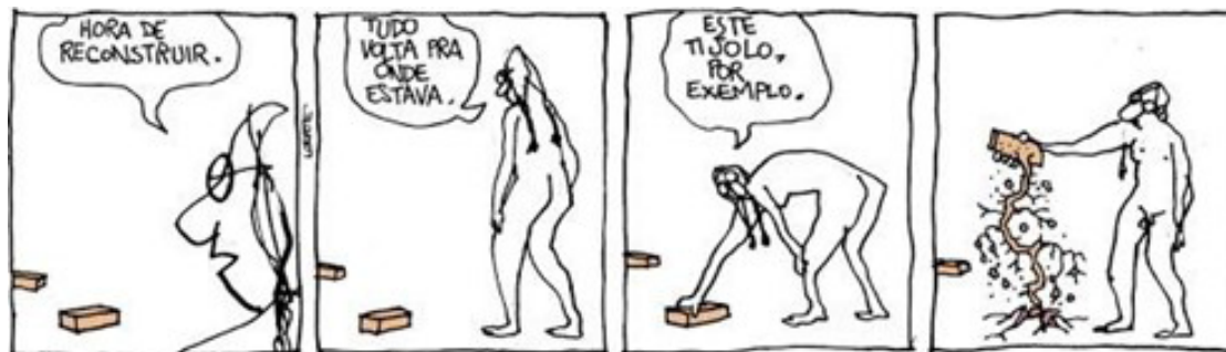
Figura 9 – Tira de 22 de fevereiro de 2021.

Com isso, seu corpo histórico fez-se história, dos quadrinhos e da visibilidade trans brasileira.