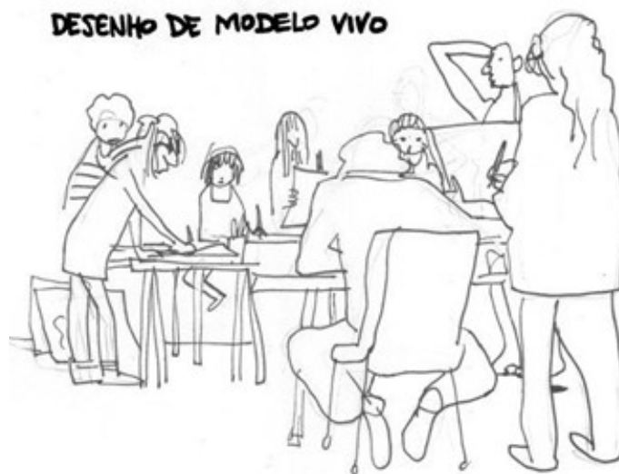
Figura 3 – Imagem de divulgação do curso de desenho da autora, abril de 2019.