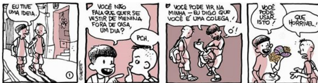
Figura 7 – Primeira parte da série “Pequeno travesti”. Publicado em 9 de julho de 2014 no blog “Manual do Minotauro”.

A série “O pequeno travesti”, porém, publicada em 2014, parece em um tom mais feliz, cheio de cores e, a princípio, começa como um jogo infantil. Como em “Eu, travesti”, o “pequeno” precisa da cumplicidade de um amigo para poder se vestir como bem entende. Em ambas as histórias, o gênero das personagens continua no masculino, como um simples processo de experimentação (Figuras 6 e 7).