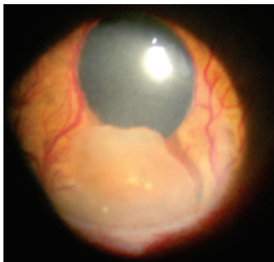
Figura 1: Fotografia de segmento anterior, mostrando deslocamento anterior do núcleo com vasos irianos proeminentes.

Ao exame, apresentou acuidade visual zero em olho direito e em olho esquerdo 20/20 com correção. O exame biomicroscópico revelou córnea com edema discreto, flare na câmara anterior, com raras células, neovasos calibrosos na íris e pupila em midríase no olho direito. O núcleo do cristalino estava deslocado para câmara anterior com cápsula anterior rompida. Com dificuldade dava para vermos as abas da cápsula anterior, principalmente quando o núcleo foi removido (Figura 1).