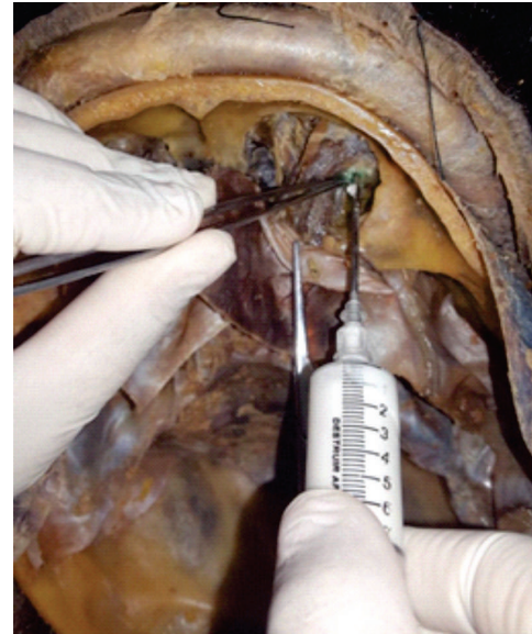
Figura 2: Injeção de borracha líquida de silicone entre o cristalino e a retina.

Após 6h da injeção do conteúdo, foi realizada a enucleação do globo ocular e estruturas adjacentes para a dissecação final e ensinamento da anatomia em aulas durante o curso (Figura 3 e 4).