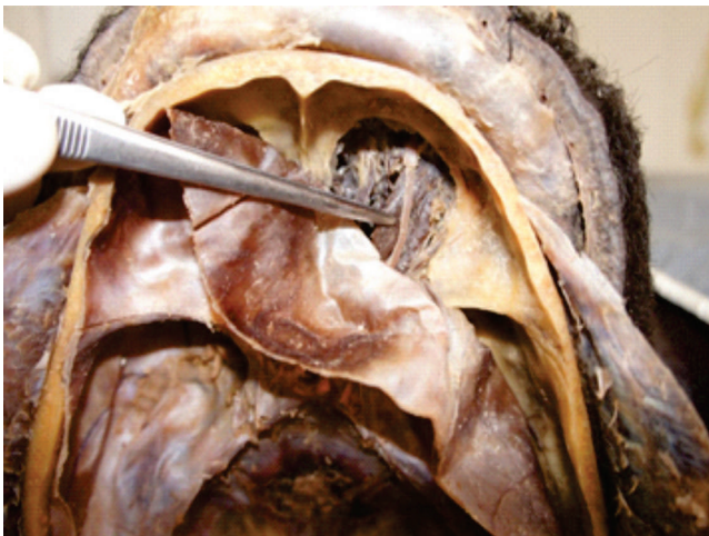
Figura 1: Exposição das estruturas orbitárias após o procedimento de incisão circular no osso frontal.

O acesso às estruturas orbitárias foi iniciado com uma incisão circular com uma serra elétrica oscilantes de lâmina semicircular na lâmina orbital do osso frontal em um cadáver que já sofreu o processo de craniotomia para estudo de estruturas encefálicas (Figura 1).