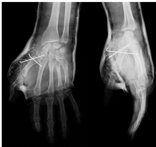
Fig. 4 Raio-x pós-operatório.

Os raios-x de mão ou polegar normalmente são suficientes para diagnosticar luxação carpometacarpal, mas lesões associadas devem ser descartadas com cuidado. A tomografia computadorizada pode ser usada para excluir lesões ósseas associadas. Ultrassonografia e ressonância magnética são úteis para avaliar lesões ligamentares e para planejar cirurgia. 9