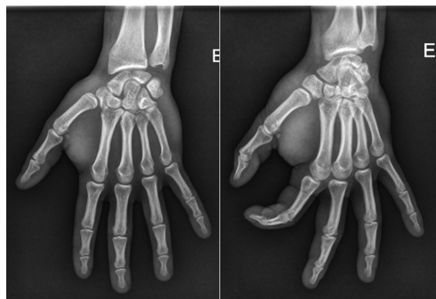
Fig. 2 Consulta de seguimento após 6 meses.

O raio-x de seguimento após 1 ano mostrou subluxação trapeziometacarpal, e instabilidade dorsal-volar foi evidenciada no exame clínico (▶ Fig. 5 ). Indicou-se redução aberta com reconstrução capsular-ligamentar, mas o paciente recusou tratamento cirúrgico.