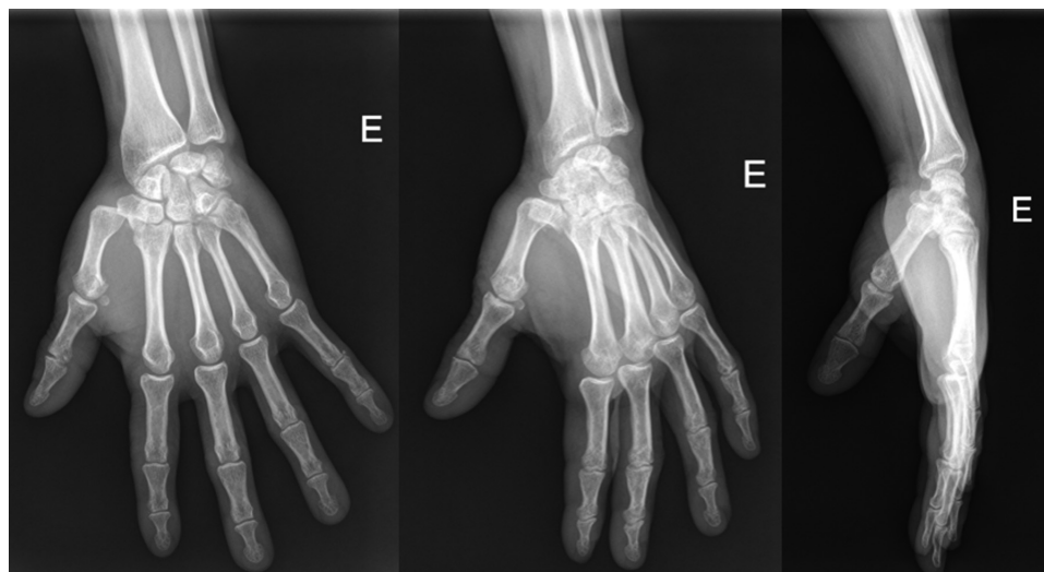
Fig. 3 Luxação trapeziometacarpal isolada.