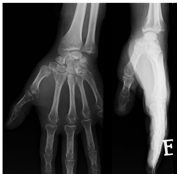
Fig. 5 Subluxação trapeziometacarpal na consulta de seguimento após 1 ano.