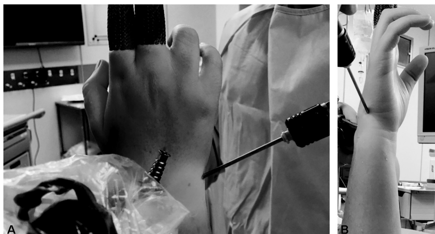
Fig. 1 (A) Vista dorsal do punho após a criação do portal piramidal-hamato (PH), que é criado distalmente ao portal 6U. (B) Vista ulnar do punho após a colocação do portal PH, criado distalmente ao portal 6U.

Em nosso único caso em que esse truque foi realizado, após o desbridamento de todas as superfícies condrais, como na técnica padrão descrita anteriormente, o portal PH foi criado para a obtenção de um excelente acesso às superfícies condrais anteriores do hamato e do capitato. Isso permitiu a ressecção de toda a cartilagem até o osso subcondral, aumentando consideravelmente a superfície de contato entre o semilunar e a cabeça do capitato, e entre a parte distal do piramidal e a superfície proximal do hamato (→ Figs. 1A, 1B, 2A, 2B, 2C e 2D ). As etapas cirúrgicas seguintes foram semelhantes àsquelas em uma abordagem padrão para uma fusão de quatro cantos. 3,4