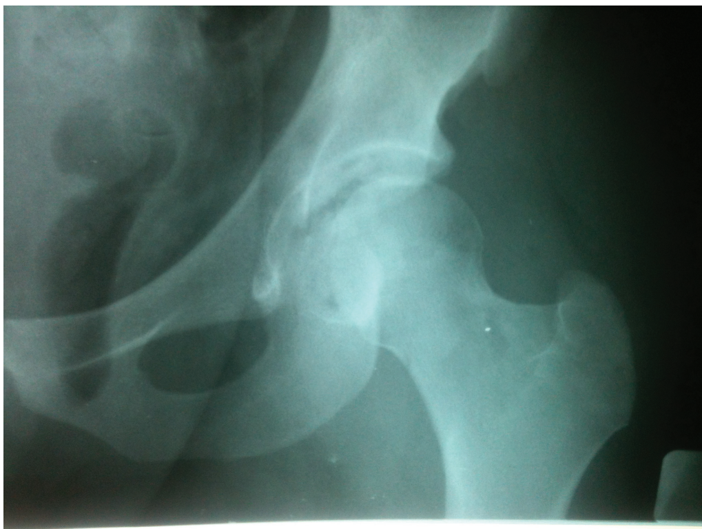
Fig. 1 Radiografia pré-operatória do quadril esquerdo em incidência anteroposterior de um paciente com pequena avulsão osteocondral da parede posterior após a redução da luxação do quadril.