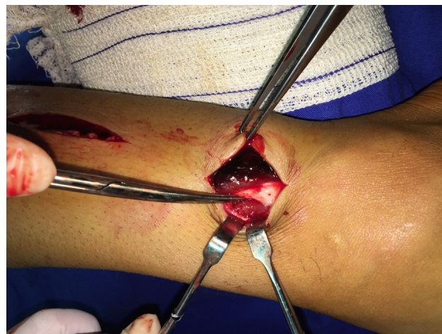
Figura 4 – Incisão distal demonstra a diferença de coloração da musculatura normal e musculatura pós-descompressão.

aguda três horas após treino padrão de futebol, sem qualquer sinal que indicasse inicialmente uma síndrome de compartimento. Evoluiu com manutenção da dor e início de sintomas neurológicos, foi mantido em observação e posteriormente levado ao bloco cirúrgico em caráter de urgência. No serviço em que foi atendido inicialmente não estavam disponíveis métodos de avaliação pressórica intracompartimental, fator que teria ajudado no diagnóstico e consequentemente tratamento precoce do paciente. Na literatura publicada, 2,3 a síndrome de compartimento não traumática em atleta apresenta frequentemente diagnóstico tardio, explicado pela raridade do quadro e presença de outros diagnósticos diferenciais mais comuns. Por se tratar de atleta de elite, foi feita fasciotomia minimamente invasiva anterolateral, com quatro acessos pequenos e liberação total da fásia. Maffulli et al. 4 publicaram estudo prospectivo em que avaliaram a fasciotomia minimamente invasiva para tratamento da síndrome compartimental lateral ou anterolateral não traumática em atletas. Os resultados evidenciaram 94% de retorno ao esporte em oito a 13 semanas. A fasciotomia tradicional apresenta