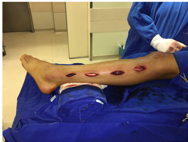
Figura 3 – Fasciotomia descompressiva com quatro incisões anterolaterais.

Nosso paciente era hígido, previamente assintomático, bem condicionado fisicamente. Apresentou sintomatologia