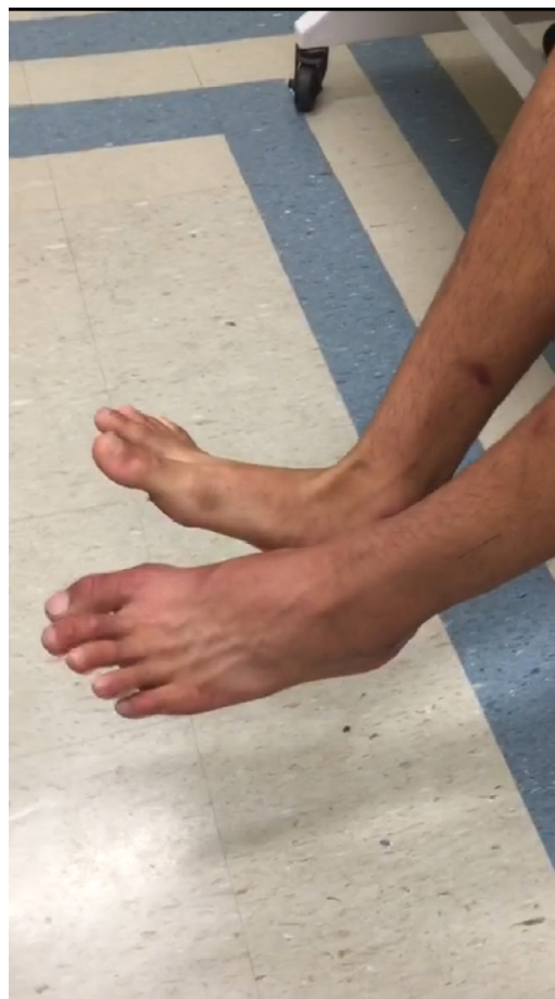
Figura 1 – Avaliação clínica pré-operatória demonstra menor extensão do hálux e alteração da função do tibial anterior.

Atleta de futebol masculino de 16 anos, sem comorbidades, previamente assintomático, treinou intensamente durante 90 minutos, sem história de traumas ou queixas durante a atividade. Após três horas, relatou início de dor moderada na região anterolateral da perna esquerda, sem sinais flogísticos associados e exame neurovascular sem alterações, foram indicados analgésico comum e crioterapia. Compareceu ao departamento médico nove horas após o treino com queixa de pioria progressiva da dor, escala visual 08/10, apresentava edema em região anterolateral da perna esquerda e dor para mobilização da musculatura extrínseca do pé e do tornozelo. Feita imobilização do membro, crioterapia, elevação, repouso e associada medicação anti-inflamatória. Atleta manteve dor importante até o outro dia de manhã, quando foi identificado início de déficit motor em território do nervo fibular comum e parestesia em região dorso lateral do pé. Apresentava ao exame físico edema em compartimento anterior e lateral da perna esquerda, diminuição de sensibilidade do primeiro espaço interdigital do pé esquerdo e diminuição de força em tibial anterior (M3), extensor longo dos dedos (M3) e hálux (M0) (fig. 1). Pulsos tibial posterior e pedioso palpáveis, perfusão capilar menor do que três segundos, sem palidez associada.