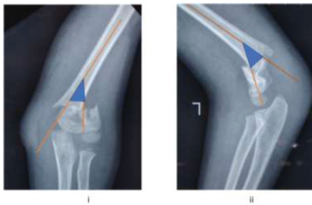
Fig. 1 (i, ii). Representação de angulação no plano coronal (i) e sagital (ii) por linhas ao longo da diáfise média do fragmento proximal e linha perpendicular à articulação do cotovelo no fragmento distal.

histórico de trauma anterior no cotovelo; 3) suspeita de displasia esquelética; e 4) registros incompletos.