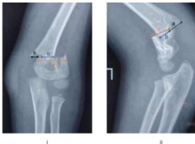
Fig. 2 (i, ii). Representação da translação e aposição óssea em plano coronal (i) e sagital (ii). Translação = a / c. Aposição óssea = b / c.

Os dados foram analisados por meio do teste qui-quadrado ou dos testes exatos de Fisher para variáveis categóricas e do teste t amostral para variáveis contínuas. As razões de chances (ORs, na sigla em inglês) foram estimadas e relatadas com intervalos de confiança (ICs) associados de 95%. As curvas ROC foram exploradas para comparação do desempenho diagnós-