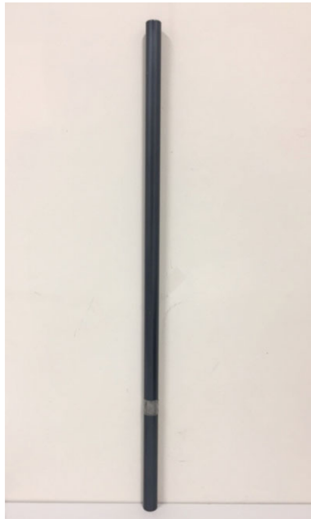
Fig. 2 Barra acessória para dinamômetro.

Todos os pacientes foram submetidos a avaliação da força muscular do bíceps braquial por meio de dinamômetro isométrico digital 18-20 (Lafayette Instrument), sendo aferida a força máxima de flexão com o cotovelo em flexão de 90 graus, e a força máxima de supinação com o antebraço na posição neutra. Para evitar viés, usou-se uma barra com marcação como referência, utilizada pelo mesmo examinador em todos os casos (► Figuras 2 e 3 ). Foram feitas quatro medidas em flexão e em supinação do cotovelo lesionado e do não lesionado. O intervalo entre as aferições foi de um minuto (► Figuras 4 e 5 ). A primeira medida de cada teste foi