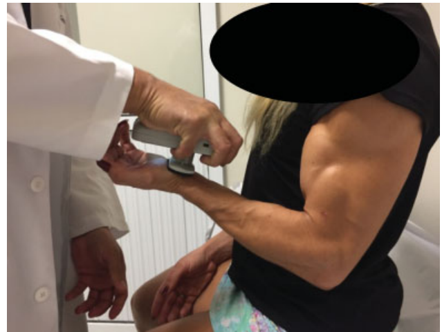
Fig. 5 Caso 13, sexo feminino, 35 anos. Teste de força em flexão.

As variáveis idade, pontuação no DASH, complicações, ADM passivo, força de flexão e supinação foram analisadas de maneira descritiva usando o programa Numbers (Apple Inc.,