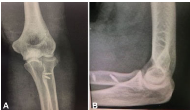
Fig. 1 Caso 7, sexo masculino, 40 anos, radiografia pós-operatória. (A) Anteroposterior; (B) perfil.

Foram realizadas radiografias nas incidências anteroposterior e de perfil do cotovelo no pós-operatório imediato para controle da colocação das âncoras, com um mês e seis meses após a cirurgia, para avaliação também da presença de ossificação heterotópica (► Figura 1A e 1B ).