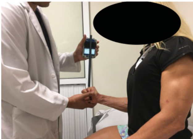
Fig. 4 Caso 13, sexo feminino, 35 anos. Teste de força em supinação.

descartada, pois serviu como treinamento para o paciente. As demais foram utilizadas para os cálculos estatísticos, em que se utilizou a média dos valores.