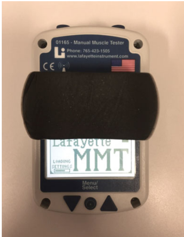
Fig. 3 Dinamômetro digital.