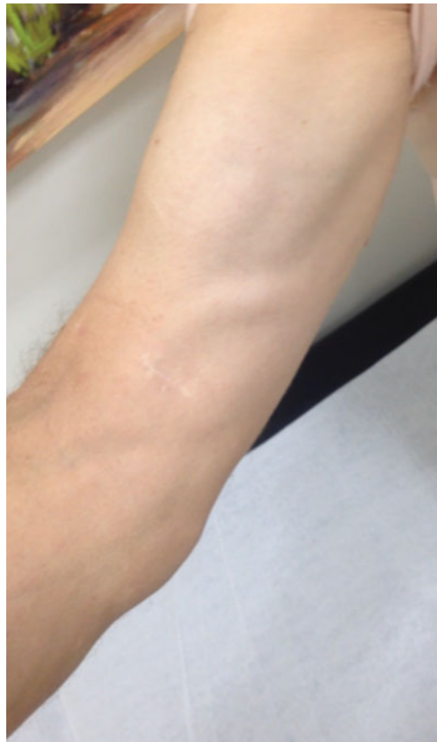
Fig. 6 Caso 8, sexo masculino, 59 anos. Aspecto pós-operatório tardio.

Schmidt et al, 9 em seu trabalho anatômico com estudo biomecânico, demonstram que a preservação da tuberosidade bicipital radial tem um efeito “cam” no momento de força de supinação, e o local anatômico de reinserção distal do bíceps encontra-se ulnarmente à essa tuberosidade. Em estudo biomecânico em cadáveres, a reinserção anatômica apresenta os mesmos resultados biomecânicos do tendão íntegro em relação à supinação, sendo os piores resultados quando a reinserção é feita radialmente à tuberosidade, sendo esta última considerada não anatômica. Nessa situação, quando compa-