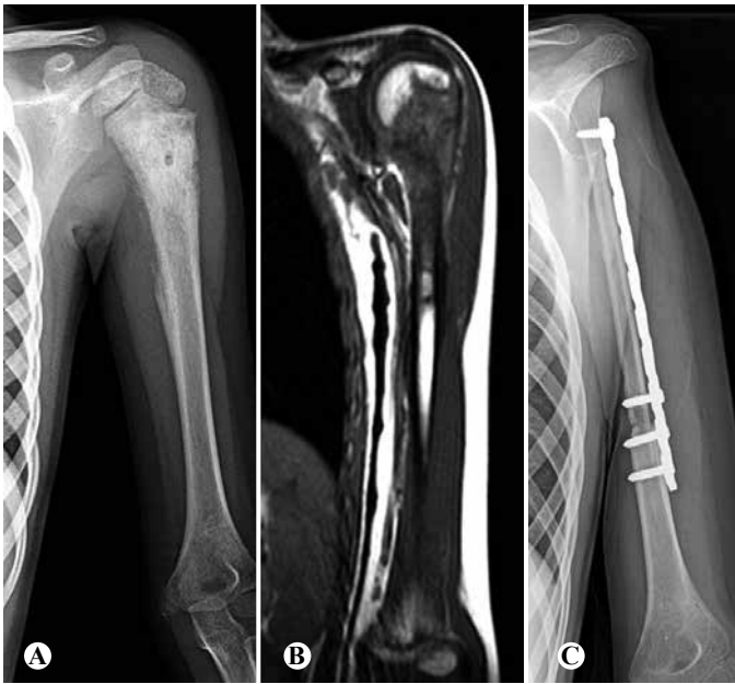
Figura 1 – Paciente de 10 anos de idade com dor na região proximal do úmero esquerdo há três meses: (A) radiografia apresentando lesão mista (osteolítica e osteoblástica), com reações periosteais em “raio-de-sol” e presença do triângulo de Codman; (B) ressonância nuclear magnética evidenciando lesão do terço proximal do úmero invadindo epífise, além de massa extraóssea; (C) radiografia pós-ressecção da lesão e reconstrução com fíbula vascularizada, preservando a epífise proximal fibular para permitir o crescimento.

diagnóstico de tumor de Ewing em um período \leq seis meses; destes, 15 (44,1%) apresentaram metástase tardia e 14 (41,1%) tiveram óbito. Trinta pacientes tiveram seu diagnóstico após seis meses, sendo que seis (20%) apresentaram metástase tardia e seis (20%) evoluíram a óbito.