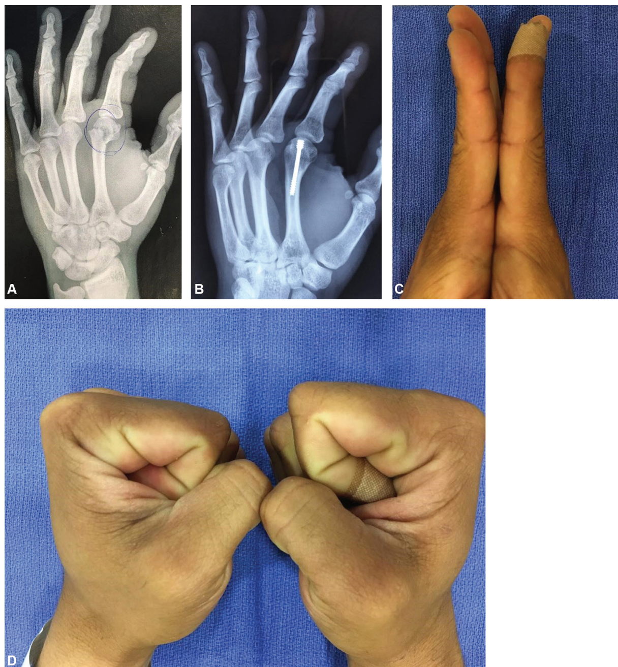
Fig. 2 A) Fratura do colo do segundo metacarpo; B) Radiografia pós-operatória tardia; C) Mínimo lag extensor; D) Leve déficit de flexão da articulação metacarpofalangeana.

todos os pacientes nessa série de 21 casos apresentados e mostrou ser uma excelente opção minimamente invasiva para o tratamento destas fraturas na mão.