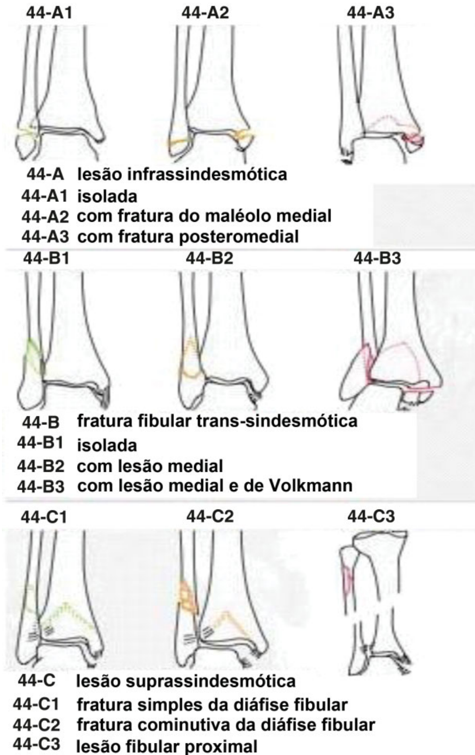
Fig. 3 Classificação AO para as fraturas de tornozelo. 7

radiográficos. Sabe-se que quanto mais próximo o Kappa for de um (1), mais forte (ou perfeita) é a concordância entre os observadores, neste caso, os observadores se assemelham sob o aspecto qualitativo da avaliação. Por outro lado, quanto mais próximo de zero (0), maior é a discordância, ou seja,