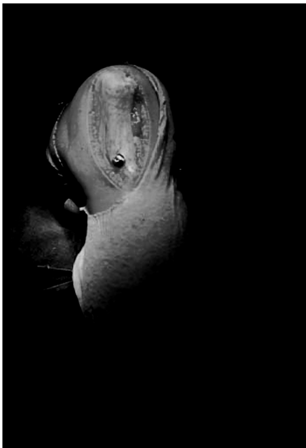
Fig. 3 Medialização da tuberosidade anterior da tíbia fixada com um parafuso esponjoso (segundo técnica de Elmslie-Trillat).