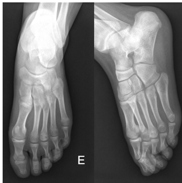
Fig. 1 Radiografia pré-operatória do pé com sustentação de peso.

Não havia relato de evento traumático, mas a paciente relembra um pequeno trauma no pé esquerdo cerca de quatro meses antes do início da dor. A dor aumentava, e era pior após