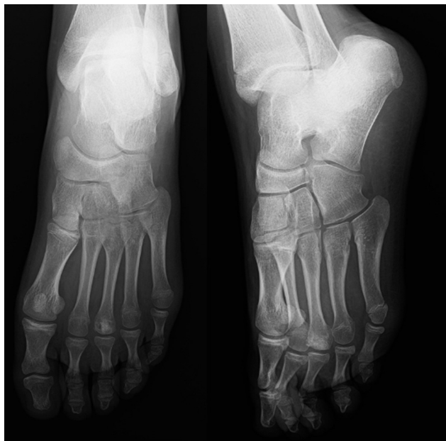
Fig. 4 Radiografia pós-operatória.

ou, pelo menos, a realização de procedimentos menos agressivos, que permitem a manutenção da anatomia original da articulação metatarsofalangiana. Esse é um ponto importante, pois os indivíduos acometidos geralmente estão na segunda ou terceira décadas de vida, e os procedimentos de destruição articular em tenra idade podem gerar outras complicações.