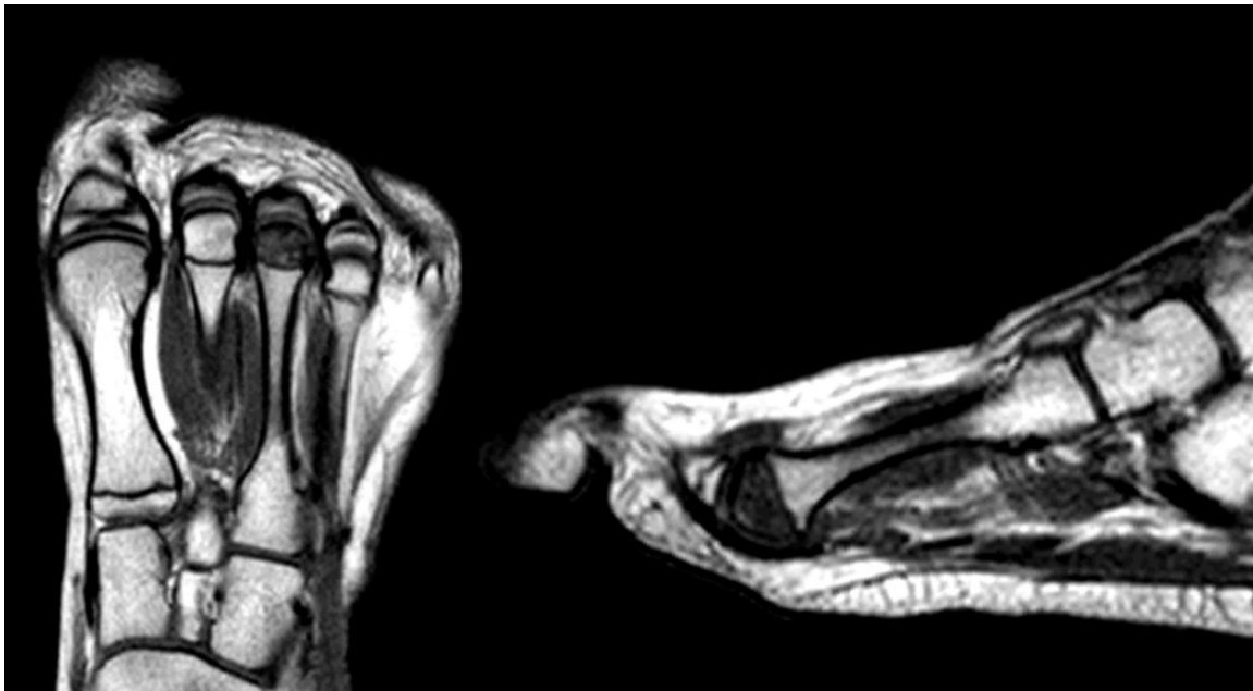
Fig. 2 Ressonância magnética pré-operatória.