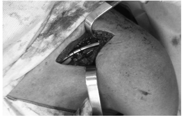
Figura 2 – Ombro esquerdo, transoperatório, pós-osteossíntese com placa bloqueada e amarrilhas com fios alta resistência.