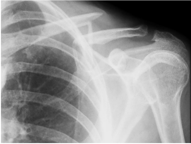
Figura 1 – Radiografia da clavícula esquerda após acidente ciclístico.