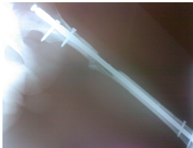
Figura 2 – Imagem radiográfica do fêmur após alongamento final na qual se observa consolidação óssea.

Foi considerado consolidado o regenerado ósseo que nas radiografias em frente e perfil apresentavam aspecto de calo ósseo visível em três corticais.