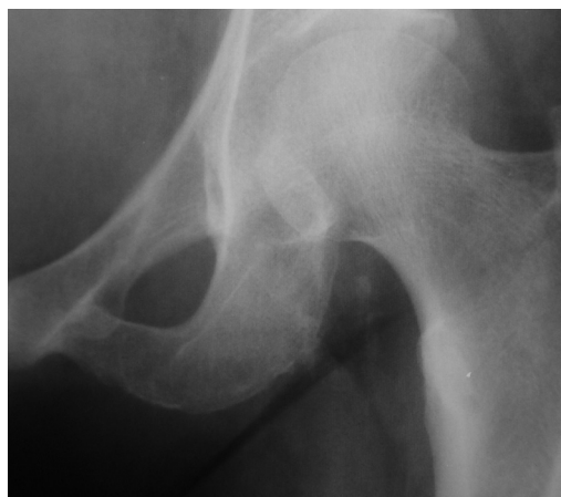
Figura 1 – Radiografia pré-operatória em AP do quadril esquerdo que evidencia discreta alteração óssea no ísquero.

A paciente chegou com queixas de ciatalgia e a avaliação radiológica complementada com tomografia computadorizada (TC) da coluna lombar não evidenciou alterações e afastou a hipótese de compressão radicular. A TC é o melhor método para visualização da arquitetura óssea, porém é inferior à ressonância nuclear magnética para avaliar partes moles. 4 Nesse momento o diagnóstico clínico foi de lombociatalgia mecânica, foram prescritos anti-inflamatórios e opioides e o caso foi acompanhado por um ano. Nesse período houve pioria da dor, o que foi um sinal de alerta e levantou a suspeita de enfermidade sistêmica, além de que, no exame clínico, observou-se comprometimento motor grau 4 das raízes nervosas de L4 (dorsoflexão do pé), L5 (extensão do hálux) e S1 (flexão plantar). A investigação foi facilitada pela queixa