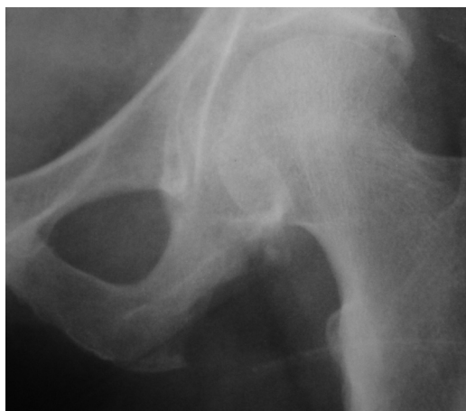
Figura 3 – Pós-operatório com ressecção em bloco da tumorção.

A malignização é a complicação mais temida, porém é de baixa frequência e ocorre em 1% dos osteocondromas solitários e 3-5% na exostose múltipla. 6 Os sinais de alerta são: crescimento rápido da lesão, aparecimento de dor, espessamento da capa de cartilagem ou descontinuidade da exostose com a cortical óssea subjacente quando, radiologicamente, perde-se a demarcação da superfície da lesão. Geralmente a transformação ocorre para condrossarcoma grau I. O estudo anatomopatológico da peça cirúrgica confirmou a suspeita