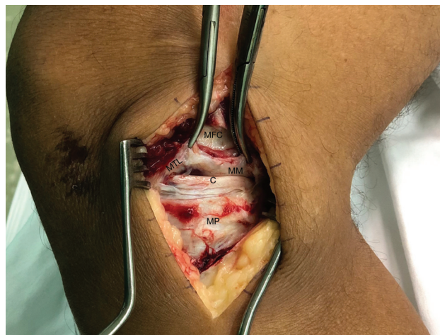
Fig. 4 Acesso para exérese dos LMTs mediais. Terceira camada medial do joelho. Inserção do LMT medial (deslocado em sentido proximal). (MTL: Menisco tibial medial; MM: Menisco medial; MFC: Côndilo femoral medial; MP: Platô medial; C: Cartilagem).

O LMT medial foi encontrado em todos os 20 joelhos estudados conforme a técnica mencionada. Em nossa amostra, o LMT medial apresentou comprimento médio de