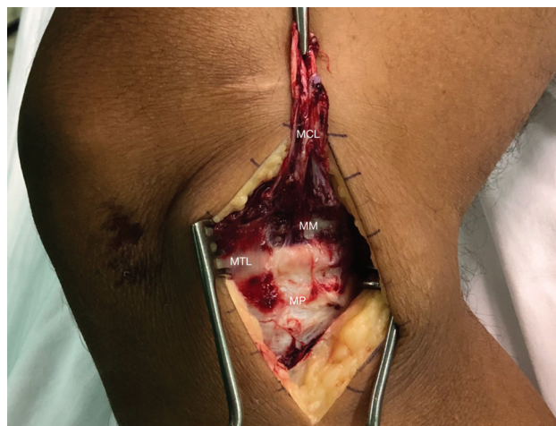
Fig. 3 Acesso para exérese dos LMTs mediais. Terceira camada medial do joelho. O ligamento colateral medial foi deslocado em sentido proximal para permitir a visualização do menisco medial e do LMT medial (inserido). (MCL: Ligamento colateral medial; MTL: Ligamento meniscotibial; MP: Platô medial; MM: Menisco medial).

superficial sobrejacente na região próxima à fixação cefálica. A porção meniscotibial do LCM profundo, no entanto, é imediatamente separada do LCM superficial sobrejacente e é chamada de ligamento coronário; ou seja, é parte do próprio LMT medial. Assim, a identificação do LCM profundo é uma excelente referência para encontrar o LMT medial e suas inserções meniscais e tibiais (►Fig. 3).