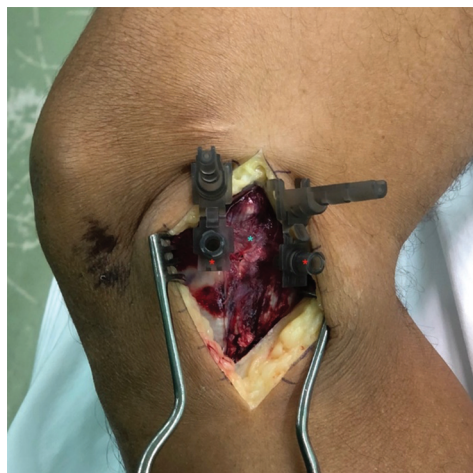
Fig. 2 Acesso para exérese dos LMTs mediais. Segunda camada medial do joelho. As agulhas revelam a posição exata da linha articular. O ligamento colateral medial está entre as agulhas (Asterisco vermelho: agulhas 25 x 7 mm; Asterisco azul: ligamento colateral medial).

Anteriormente, o LCM profundo é claramente separado do LCM superficial por uma bolsa interposta. Posteriormente, no entanto, as camadas se unem porque a porção meniscofemoral do LCM profundo tende a se fundir com o LCM